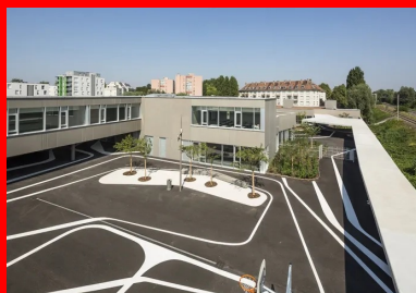
Les cours de récréation (ici, celle de l'école élémentaire) sont protégés des nuisances de voies ferrées par un mur écran.

Les circulations sont ponctuées d'arrivées de lumière naturelle et de vues sur la vie intérieure comme sur le monde extérieur, qui agrémentent les déplacements des enfants. Les éléments de structure du projet sont réalisés en béton coulé en place. Les panneaux en béton préfabriqué mis en œuvre, de type murs à coffrage et isolation intégrés, participent à la très bonne étanchéité à l'air de l'enveloppe du bâtiment, qui est conforme à la RT 2012.