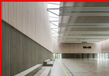
Une ambiance douce et lumineuse régnait dans la grande salle de sport.

Le groupe scolaire et le gymnase s'inscrivent dans un édifice unique qui se développe le long de la promenade. L'IME est quant à lui inclus dans ce bâtiment, entre le groupe scolaire et le gymnase. Le terrain, en forme de trapèze très étiré, mesure 250 m de long pour une largeur moyenne de 50 m.