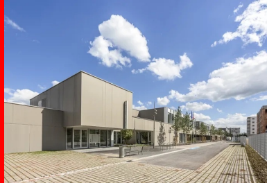
Le groupe scolaire et le gymnase s'inscrivent dans un bâtiment dont l'enveloppe dessine un écran fédérateur et qualifie l'espace public de la promenade.

À Ingolsheim, dans la périphérie de Strasbourg, le site de 13 hectares des anciennes usines des Tanneries de France accueille aujourd'hui l'écoquartier des Tanneries. Ce nouveau morceau de ville, à vocation essentiellement résidentielle, comprendra à terme 1 200 logements et accueillera, à l'horizon 2020, environ 3 000 habitants. Il est également pourvu d'un pôle d'équipements publics réunissant un groupe scolaire de 18 classes (maternelle et élémentaire), dont 2 classes d'accueil pour des enfants handicapés, un institut médico-éducatif (IME), un gymnase et une résidence seniors de 55 logements. Au-delà de la réponse apportée aux besoins des habitants, cet ensemble d'équipements publics constitue le cœur du quartier des Tanneries.