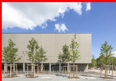
Vue sur le gymnase qui s'ouvre par une longue baie vitrée sur le square et le quartier.

Les architectes ont conçu un véritable bâtiment paysage, qui donne à voir et à être vu. Le bâti affiche sur la rue une alternance de pleins, de creux, de vides, de retraits, de transparences, qui rythment le volume global. Cela permet d'exprimer l'identité de chaque entité dans une enveloppe unificatrice, faite de panneaux en béton préfabriqué de type murs à coffrage et isolation intégrés, recouverts d'une lasure gris/vert. Cette enveloppe dessine un écran fédérateur et ordonné, qualifiant l'espace public.