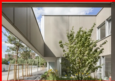
Un patio planté accompagne chaque entrée et la met en scène pour en faire une vraie adresse.

et latéraux est ainsi composé. Chaque espace s'étire au-delà de ses propres limites. De même, les déplacements des usagers sont ponctués par les arrivées de lumière naturelle et l'enchaînement des vues. Le béton brut, les lignes de bois clair ou foncé des faux plafonds ou des revêtements muraux composent un environnement intérieur neutre qui donne une ambiance claire, douce et lumineuse aux lieux. Dans la salle de sport, une longue baie vitrée en partie basse de la facade ouvre l'espace sur le square et le quartier. La lumière naturelle pénètre par les deux bords longitudinaux de la couverture de la salle, qui semble flotter avec légèreté au-dessus du plateau sportif.