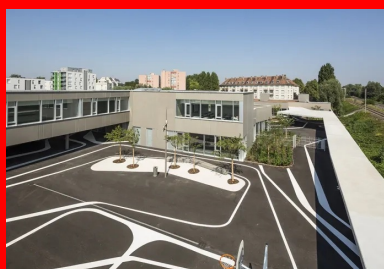
Les cours de récréation (ici, celle de l'école élémentaire) sont protégés des nuisances de voies ferrées par un mur écran.

Les circulations sont ponctuées d'arrivées de lumière naturelle et de vues sur la vie intérieure comme sur le monde extérieur, qui agrémentent les déplacements des enfants. Les éléments de structure du projet sont réalisés en béton coulé en place. Les panneaux en béton préfabriqué mis en œuvre, de type murs à coffrage et isolation intégrés, participent à la très bonne étanchéité à l'air de l'enveloppe du bâtiment, qui est conforme à la RT 2012.