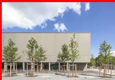
Vue sur le gymnase qui s'ouvre par une longue baie vitrée sur le square et le quartier.

Les architectes ont conçu un véritable bâtiment paysage, qui donne à voir et à être vu. Le bâti affiche sur la rue une alternance de pleins, de creux, de vides, de retraits, de transparences, qui rythment le volume global. Cela permet d'exprimer l'identité de chaque entité dans une enveloppe unificatrice, faite de panneaux en béton préfabriqué de type murs à coffrage et isolation intégrés, recouverts d'une lasure gris/vert. Cette enveloppe dessine un écran fédérateur et ordonné, qualifiant l'espace public.