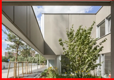
Un patio planté accompagne chaque entrée et la met en scène pour en faire une vraie adresse.

et latéraux est ainsi composé. Chaque espace s'étire au-delà de ses propres limites. De même, les déplacements des usagers sont ponctués par les arrivées de lumière naturelle et l'enchaînement des vues. Le béton brut, les lignes de bois clair ou foncé des faux plafonds ou des revêtements muraux composent un environnement intérieur neutre qui donne une ambiance claire, douce et lumineuse aux lieux. Dans la salle de sport, une longue baie vitrée en partie basse de la facade ouvre l'espace sur le square et le quartier. La lumière naturelle pénètre par les deux bords longitudinaux de la couverture de la salle, qui semble flotter avec légèreté au-dessus du plateau sportif.