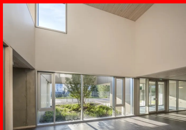
Dans le hall d'entrée de l'école maternelle, une fenêtre intérieure, à l'étage, crée un lien visuel avec l'école élémentaire.

Dans les espaces intérieurs, qu'il s'agisse des salles ou des circulations, on retrouve le béton brut , le bois clair en faux plafond et en revêtement mural. Un soin particulier apporté aux détails et aux usages, l'élégance des lignes composent une ambiance apaisante et rassurante. Dans toutes les salles, la qualité de la lumière naturelle participe au confort des enfants et leur offre des conditions sereines d'apprentissage. Des stores screen extérieurs permettent, si nécessaire, de se protéger du rayonnement solaire direct, pour éviter éblouissement ou réchauffement.