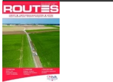
Cet article est extrait de Routes n°145

Maitrise d'ouvrage : Département de l'Ain - Maitrise d'œuvre : Département de l'Ain - Entreprises : Eurovia, Famy - Mise en œuvre du béton : Agilis - Fournisseur du béton : Béton Vicat (centrale de Péruges) - Fournisseur du ciment : Vicat (usine de Montaleu)