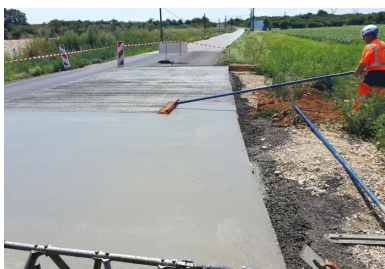
Après mise en place, le béton a été balayé pour l'adhérence et la tenue de route des véhicules.

Le giratoire en béton constitue une réponse très pertinente à ces pathologies. Le département de l'Ain étant à la fois maître d'ouvrage et maître d'œuvre du projet, ses responsables techniques se sont rendus à Billom pour constater l'intérêt de la solution offerte par le giratoire en béton et le bon comportement de l'ouvrage. La visite ayant été concluante, un appel d'offres public a été lancé.