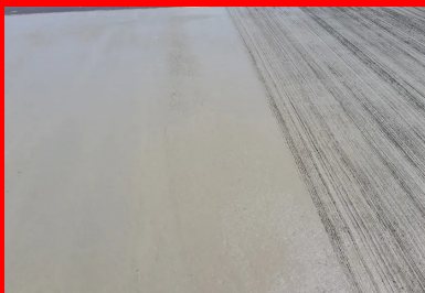
Les joints de retrait et le béton avec sa finition balayée.

Située dans la plaine de l'Ain, à proximité de la région naturelle et historique de la Dombes, la commune de Pérouges est connue pour sa cité médiévale. Cet ancien bourg de tisserands, entouré de remparts, est classé parmi les plus beaux villages de France. La route départementale RD65b traverse le territoire de la commune, permettant, au sud, de rallier l'autoroute A42. À la frontière méridionale du territoire communal, cet axe permet également d'accéder à une carrière exploitée par Vicat, d'une part, et à un terrain appartenant également à Vicat, d'autre part. Cette configuration particulière génère d'ores et déjà un important trafic de poids lourds, promis à se développer à l'avenir. Il soumet la chaussée, dont le revêtement était jusqu'alors en enrobé, à d'importantes sollicitations.