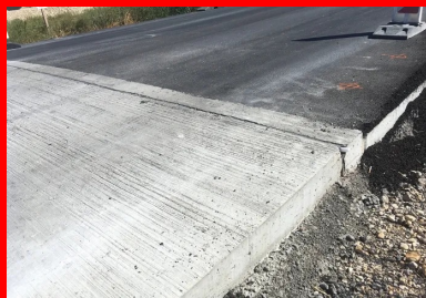
Une dalle de transition avant et après la mise en œuvre de l'enrobé.