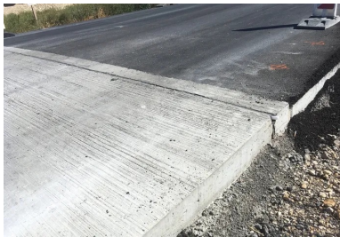
Une dalle de transition avant et après la mise en œuvre de l'enrobé.