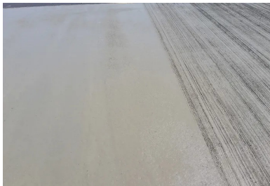
Les joints de retrait et le béton avec sa finition balayée.

Située dans la plaine de l'Ain, à proximité de la région naturelle et historique de la Dombes, la commune de Pérouges est connue pour sa cité médiévale. Cet ancien bourg de tisserands, entouré de remparts, est classé parmi les plus beaux villages de France. La route départementale RD65b traverse le territoire de la commune, permettant, au sud, de rallier l'autoroute A42. À la frontière méridionale du territoire communal, cet axe permet également d'accéder à une carrière exploitée par Vicat, d'une part, et à un terrain appartenant également à Vicat, d'autre part. Cette configuration particulière génère d'ores et déjà un important trafic de poids lourds, promis à se développer à l'avenir. Il soumet la chaussée, dont le revêtement était jusqu'alors en enrobé, à d'importantes sollicitations.