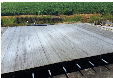
Les goujons métalliques d'une longueur de 0,45 m et d'un diamètre de 30 mm.