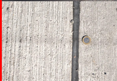
Les joints de retrait et le béton avec sa finition balayée.