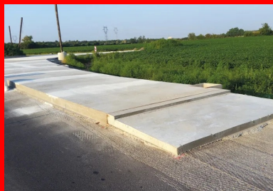
Une dalle de transition avant et après la mise en œuvre de l'enrobé.