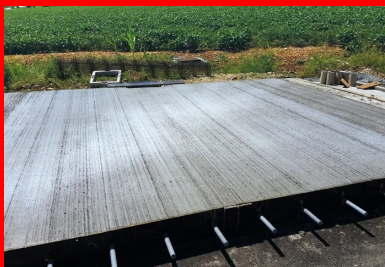
Les goujons métalliques d'une longueur de 0,45 m et d'un diamètre de 30 mm.