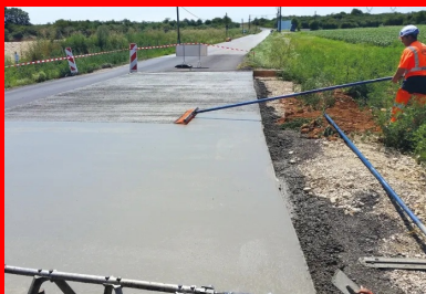
Après mise en place, le béton a été balayé pour l'adhérence et la tenue de route des véhicules.

Le giratoire en béton constitue une réponse très pertinente à ces pathologies. Le département de l'Ain étant à la fois maître d'ouvrage et maître d'œuvre du projet, ses responsables techniques se sont rendus à Billom pour constater l'intérêt de la solution offerte par le giratoire en béton et le bon comportement de l'ouvrage. La visite ayant été concluante, un appel d'offres public a été lancé.