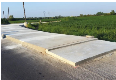
Une dalle de transition avant et après la mise en œuvre de l'enrobé.