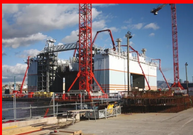
Le bétonnage continu des caissons est réalisé par l'intermédiaire de trois mâts de bétonnage, reliés sur le quai à trois pompes à béton, alimentées par des camions toupies béton.

Le tout en restant particulièrement attentif à la maîtrise des impacts écologiques du projet