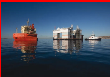
Fabriqués en Pologne, le caissonnier Marco Polo a été convoyé sur un navire submersible à travers la mer du Nord, la Manche, l'Atlantique, le détroit de Gibraltar et enfin la Méditerranée. Il est arrivé au Grand Port de Marseille après un périple de 14 jours.

Le volume impressionnant de béton nécessaire à la fabrication de chaque caisson (3 600 m 3 pour les treize plus gros, hors poteaux Jarlan ) est ainsi coulé par l'intermédiaire de trois mâts de bétonnage, capables de placer le béton en tout point du coffrage glissant . Ces mâts sont reliés en contrebas à autant de pompes à béton, elles-mêmes alimentées en permanence par deux à trois camions toupies par heure, en provenance des deux centrales à béton des industriels Lafarge et Cemex, la première étant située sur le port de Marseille, l'autre à proximité. Pour sécuriser l'approvisionnement et la production, des pompes de secours et une troisième centrale à béton sont disponibles à tout moment.