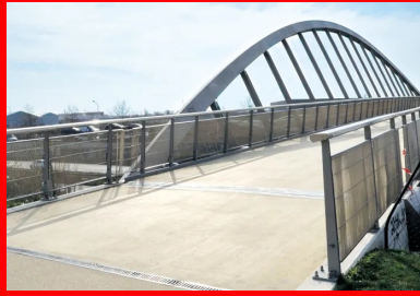
En 2016, une passerelle de 230 m de long, dessinée par l'architecte Marc Mimram, a permis à la Tégéval d'empiéter la RN406 à la hauteur de Créteil et de Valenton.

En 2013, le projet est déclaré d'utilité publique, et les premières réalisations concrètes voient le jour. Trois chantiers sont inaugurés en octobre 2014 à Valenton et à Limeil-Brevannes. En 2016, dessinée par l'architecte Marc Mimram, une passerelle de 230 m de long enjambe la RN406 à la hauteur de Créteil et de Valenton. Actuellement, selon le site Internet de la Tégéval, « 4,5 km sont déjà aménagés et 7 km sont accessibles. Les aménagements s'achèveront dans une quinzaine d'années, mais, dès 2020, l'intégralité du parcours sera accessible. »