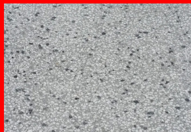
(En médaillon) Des granulats provenant de la carrière savoyarde de Grésy-sur-Aix ont été utilisés avec un mélange de basalte.

Au total, 2 700 m 3 ont été réalisés avec du 4/8 Grésy 90 % et du 6/10 basalte 10 % en ciment gris, dont 1 800 m 3 de béton bouchardé et 900 m 3 de béton sablé, et 550 m 3 en désactivé, avec du 8/20 Grésy 80 % et 10/14 basalte, 20 % en ciment gris. « Le béton provenait de la centrale Béton Vicat de Villaz (Haute-Savoie), située à proximité du chantier. Cette centrale est bien adaptée à la fabrication des bétons décoratifs grâce à ses nombreux cases », souligne Anthony Mayet de Béton Vicat Haute-Savoie.