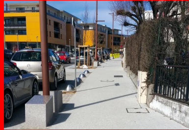
Les travaux se sont concentrés sur une zone de 400 m de long située sur la rue commerciale du bourg.

Au nord d'Anancy, Pringy est située sur l'ancienne route de Genève (ex-RD1201). On y accède par une longue avenue qui traverse également Anancy et Anancy-le-Vieux. À l'origine commune à part entière, la petite agglomération a fusionné au 1 er janvier 2017 avec les communes voisines d'Anancy, d'Anancy-le-Vieux, de Cran-Gevrier, de Meythet et de Seynod. Le nouvel ensemble constitue la commune nouvelle d'Anancy, qui compte désormais plus de 120 000 habitants.