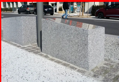
Le mélange de granulats Grésy avec une incorporation de basalte noir apporte un effet moucheté en surface, qui s'harmonise bien avec le granit, en créant un ensemble homogène.

« En ce qui concerne la mise en œuvre, elle a nécessité une grande attention. Il faut vraiment un savoir-faire pour obtenir une régularité et une homogénéité sur ce type de chantier, compte tenu de sa longueur et de son séquençage. Le chantier a démarré en hiver et s'est fini, pour l'essentiel, en été. L'entreprise a dû s'adapter aux variations de température, et la mise en œuvre ne s'est pas faite à la même vitesse selon les zones... Malgré ces contraintes, le partenariat de Béton Vicat et de l'entreprise Mithieux a permis d'obtenir une belle réalisation », se félicite Anthony Mayet de Vicat. Encore une belle référence pour le béton décoratif en Rhône-Alpes !