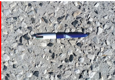
Le granulats B/20 utilisé pour les places de stationnement s'incorpore aisément dans le béton et résiste bien à l'arrachement.