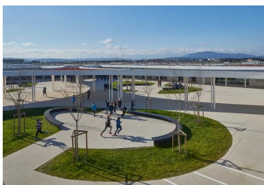
Le système en cour de cloître forme une protection contre les vents fréquents.

En pénétrant dans la cour, les quatre ailes s'offrent d'un seul regard, abritant à l'ouest, de chaque côté d'un couloir central ponctué d'un patio , les locaux administratifs et les locaux collectifs des élèves donnant sur la cour (CDI, foyer, sanitaires). Au nord, se trouve le pôle Segpa. Les deux autres ailes accueillent les salles d'art, de sciences et d'enseignement général au sud.