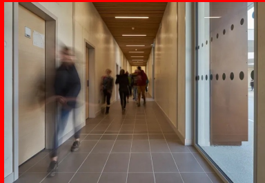
Les circulations sont vastes et éclairées le plus naturellement possible.

L'extraction se fait par des petites tourelles métalliques posées sur le toit au-dessus de chaque salle de classe. Celles-ci sont constituées d'un ventilateur, de supports et d'un grillage anti-volatile. Lorsque le ventilateur se met en route, il crée une dépression sous le capot et force la circulation de l'air.