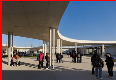
Le bâtiment est organisé autour d'un atrium central.

Le programme est très classique pour ce type d'établissement : les bureaux pour l'administration, les locaux pour les enseignants, les salles d'enseignement général, scientifique, artistique, technologique, ainsi qu'une section Segpa service à la personne, vente et cuisine. Il peut accueillir 600 élèves, mais a été conçu pour recevoir une extension (en partie est), sans dénaturer le fonctionnement de l'établissement.