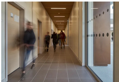
Les circulations sont vastes et éclairées le plus naturellement possible.

L'extraction se fait par des petites tourelles métalliques posées sur le toit au-dessus de chaque salle de classe. Celles-ci sont constituées d'un ventilateur, de supports et d'un grillage anti-volatile. Lorsque le ventilateur se met en route, il crée une dépression sous le capot et force la circulation de l'air.