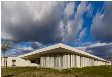
La salle polyvalente constitue un élément structurant fort de l'établissement.

« Lorsque nous avons visité les lieux la première fois, nous étions un peu désespérés car nous nous retrouvions sur une parcelle toute plate, au milieu des champs et en plein vent, avec tout autour une zone pavillonnaire en extension. Mais l'atout majeur du terrain était sa vaste surface de 25 000 m 2 ! » explique Antoine Assus, l'un des associés de l'agence BPA. Et de fait, c'est l'importante étendue du terrain qui fut le point de départ de la conception architecturale de l'équipement en permettant une construction de plain-pied, sur un peu plus de 4 000 m 2 .