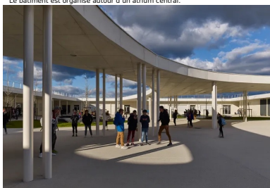
Le bâtiment est organisé autour d'un atrium central.