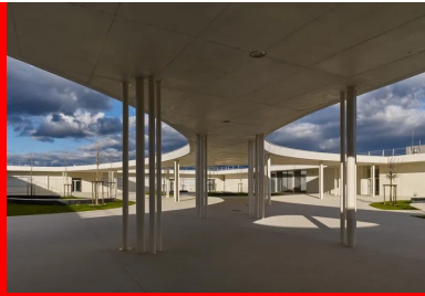
La couverture partielle de la cour crée des cadres vers le ciel.

Plus vaste que dans le programme du concours , elle couvre une surface de 2 770 m 2 .