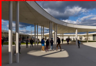
Le bâtiment est organisé autour d'un atrium central.