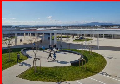
Le système en cour de clôture forme une protection contre les vents fréquents.

En pénétrant dans la cour, les quatre ailes s'offrent d'un seul regard, abritant à l'ouest, de chaque côté d'un couloir central ponctué d'un patio , les locaux administratifs et les locaux collectifs des élèves donnant sur la cour (CDI, foyer, sanitaires). Au nord, se trouve le pôle Segpa. Les deux autres ailes accueillent les salles d'art, de sciences et d'enseignement général au sud.