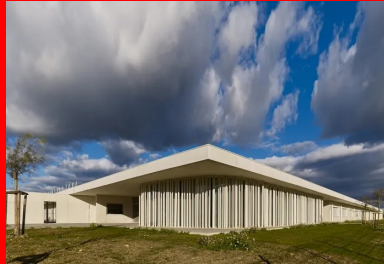
La salle polyvalente constitue un élément structurant fort de l'établissement.

« Lorsque nous avons visité les lieux la première fois, nous étions un peu désespérés car nous nous retrouvions sur une parcelle toute plate, au milieu des champs et en plein vent, avec tout autour une zone pavillonnaire en extension. Mais l'atout majeur du terrain était sa vaste surface de 25 000 m 2 ! » explique Antoine Assus, l'un des associés de l'agence BPA. Et de fait, c'est l'importante étendue du terrain qui fut le point de départ de la conception architecturale de l'équipement en permettant une construction de plain-pied, sur un peu plus de 4 000 m 2 .