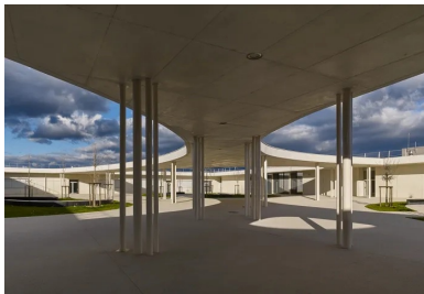
La couverture partielle de la cour crée des cadres vers le ciel.

Plus vaste que dans le programme du concours , elle couvre une surface de 2 770 m 2 .