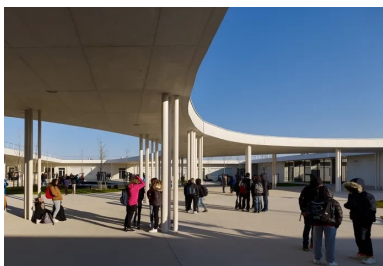
Le bâtiment est organisé autour d'un atrium central.

Le programme est très classique pour ce type d'établissement : les bureaux pour l'administration, les locaux pour les enseignants, les salles d'enseignement général, scientifique, artistique, technologique, ainsi qu'une section Segpa service à la personne, vente et cuisine. Il peut accueillir 600 élèves, mais a été conçu pour recevoir une extension (en partie est), sans dénaturer le fonctionnement de l'établissement.