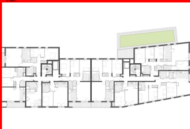
Plan étage courant