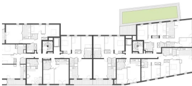
Plan étage courant