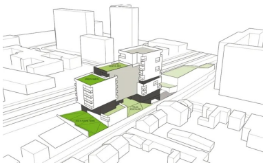
Schéma étage plantation