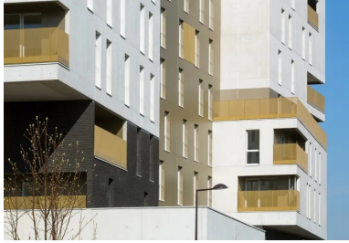
Une composition générale accentuée par le contraste des couleurs.

La pérennité de l'ouvrage est, quant à elle, assurée par la combinaison de refends porteurs et de façades porteuses en béton brut autoportant coulé en place.