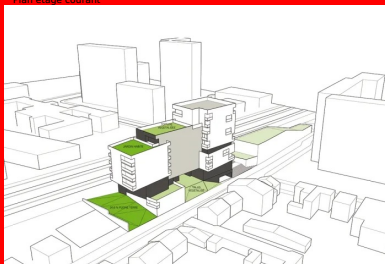
Schéma étage plantation