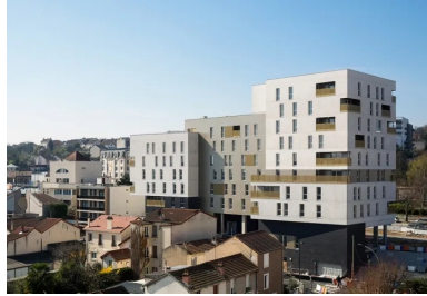
Découpée en trois parties, l'opération s'élève progressivement de R+5 à R+8.

La Zac Rouget-de-Lisle est située au sud de la ville de Vitry-sur-Seine, à proximité immédiate de l'A86. Son périmètre se développe sur environ 9 hectares le long de l'avenue qui relie le xiii e arrondissement de Paris à Orly. Il recouvre une emprise en fuseau composée d'une succession d'îlots en mutation. Dessiné par l'architecte Carmen Santana de l'agence Archikubik, le plan directeur du nouveau quartier est structuré par de nombreuses liaisons transversales. Autant de percées qui renforcent les liens entre la commune, le fleuve qui la borde à l'est et le parc des Lilas à l'ouest.