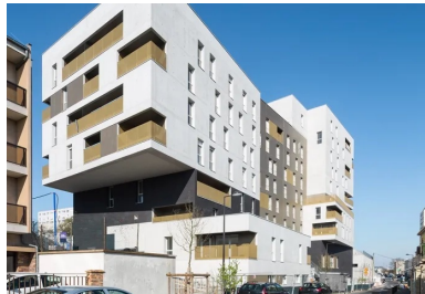
Au sud, un porte-à-faux assure la transition avec le bâtiment voisin.

De cette problématique émerge un immeuble-proue, qu'ils insèrent à l'alignement de l'avenue Rouget-de-Lisle. Le volume longiligne est déformé verticalement et horizontalement au gré du découpage parcellaire selon un épannelage en trois parties qui l'élève progressivement de R+5 à R+8. Egalement présent dans le sens transversal, cet étagement passe de R+5 à R+1 entre l'avenue et la petite rue Coquelin située sur l'arrière. En transposant le tissu fragmenté du pavillonnaire à l'échelle des grandes barres des années soixante, la volumétrie du bâtiment établit un lien spatial entre les deux quartiers. En rez-de-chaussée, l'implantation d'un commerce ouvrant par de grandes baies vitrées sur une nouvelle place conforte cette intention en contribuant à l'animation de la vie locale.