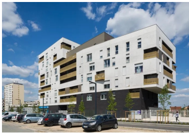
Décalages des volumes et espaces en creux.