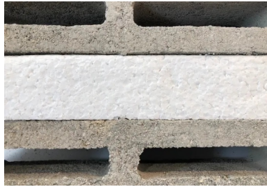
bloc béton isolant PSE