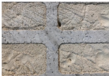
bloc béton isolant mousse minérale