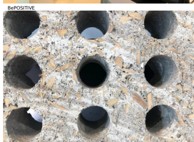
bloc béton isolant