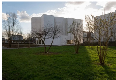
La hauteur de l'église s'accorde à celle des bâtiments alentour.

Accessible par un escalier fermé, dans la continuité de la circulation verticale secondaire qui comprend l'ascenseur, la petite sacristie occupe le dernier étage.