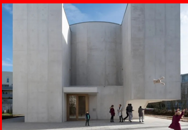
Façade ouest d'entrée : l'espace public et le parvis de l'église se confondent.

À deux pas de la mairie et jouxtant les vestiges d'une chapelle du xviii e siècle, le site retenu est une petite parcelle contrainte de 400 m 2 . Il est compris entre un bassin d'eau qui le sépare de la rue du Haut-Bois, une voie départementale et des cheminements piétons. Autour, des immeubles de logement de cinq étages, des espaces verts et, un peu plus loin, des équipements caractérisent ce nouveau quartier devenu le cœur de Saint-Jacques-de-la-Lande.