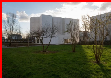
La hauteur de l'église s'accorde à celle des bâtiments alentour.

Accessible par un escalier fermé, dans la continuité de la circulation verticale secondaire qui comprend l'ascenseur, la petite sacristie occupe le dernier étage.