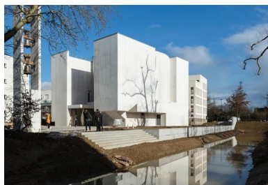
Le demi-cylindre de l'abside émerge en porte-à-faux de la façade est.

D'apparence simple, le schéma structurel est en réalité complexe. Le renvoi des forces structurelles très important disparaît dans la masse, introduisant une ambiguïté avec ce qui est visible.