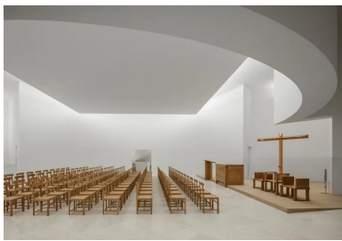
Le panneau carré surplombe la partie centrale de l'église. Il diffuse la lumière zénithale de la verrière située au-dessus.

À l'opposé, en façade ouest , s'avancent deux volumes rectangulaires de part et d'autre de l'entrée. L'angle sud s'interrompt au-dessus du sol, incisé d'une entaille triangulaire qui exprime une volée de l'escalier qu'il contient. Des couvertines en marbre marquent discrètement le haut des murs intermédiaires et des terrasses, du zinc étant réservé à la toiture.