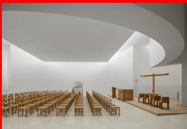
Le panneau carré surplombe la partie centrale de l'église. Il diffuse la lumière zénithale de la verrière située au-dessus.

À l'opposé, en façade ouest, s'avancent deux volumes rectangulaires de part et d'autre de l'entrée. L'angle sud s'interrompt au-dessus du sol, incisé d'une entaille triangulaire qui exprime une volée de l'escalier qu'il contient. Des couvertines en marbre marquent discrètement le haut des murs intermédiaires et des terrasses, du zinc étant réservé à la toiture.