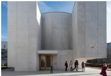
Façade ouest d'entrée : l'espace public et le parvis de l'église se confondent.

À deux pas de la mairie et jouxtant les vestiges d'une chapelle du XVIII e siècle, le site retenu est une petite parcelle contrainte de 400 m 2 . Il est compris entre un bassin d'eau qui le sépare de la rue du Haut-Bois, une voie départementale et des cheminements piétons. Autour, des immeubles de logement de cinq étages, des espaces verts et, un peu plus loin, des équipements caractérisent ce nouveau quartier devenu le cœur de Saint-Jacques-de-la-Lande.