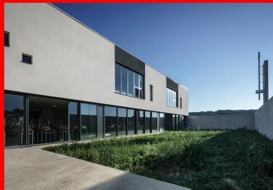
La grande salle s'ouvre sur l'espace clos de l'oratoire extérieur.

« Le projet se compose de deux volumes, l'un au rez-de-chaussée et l'autre au R+1, qui jouent sur des glissements de l'un par rapport à l'autre dans les deux directions, à la fois dans le sens perpendiculaire et dans le sens parallèle. Ce travail est souligné par les matériaux des façades. L'enveloppe du rez-de-chaussée est en béton brut de décoffrage et celle de l'étage en enduit blanc », explique Antoine Pélissier de l'agence Agapé architectes. Dans cet esprit, les deux parois latérales de la salle d'étude se prolongent vers l'extérieur et dessinent le mur de clôture de l'espace de l'oratoire extérieur qui est tenu par les lignes pures et la géométrie orthogonale des voiles de béton.