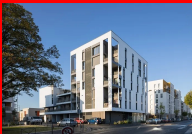
Le volume cubique vertical de l'immeuble plot participe au front bâti de la rue Daniel-Meyer.

Les volumes bâtis sont reliés entre eux par un bâtiment intermédiaire à R+2 qui aménage des percées vers l'intérieur de la parcelle sous forme de liaisons douces. Les niveaux supérieurs sont desservis par de longues coursives équipées d'escaliers à chacune de leurs extrémités : d'une part au cœur de l'immeuble-pilot, en lien avec l'ascenseur, et d'autre part, sur le pignon de la barre. La résidence est ainsi dotée de deux entrées : une depuis le hall, l'autre directement depuis la rue.