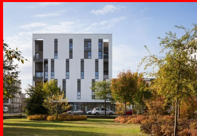
Vue depuis le parc.