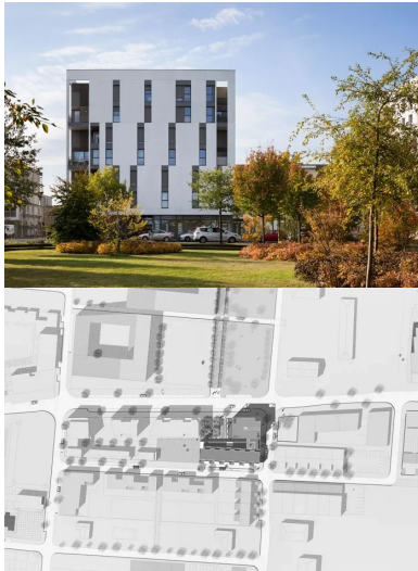
Vue depuis le parc.

Le respect des impératifs thermiques est donc passé par une logique architecturale, constructive et économique mettant le béton en avant, dont Nathalie Régnier-Kagan se déclare particulièrement fière : « l'agence a toujours défendu le béton en façade ». C'est un matériau qui se suffit à lui-même. Il se peint, se lasure, se relasure et, finalement, s'avère véritablement pérenne et plus économique que des vêtements ou des bardages souvent onéreux et peu durables. »