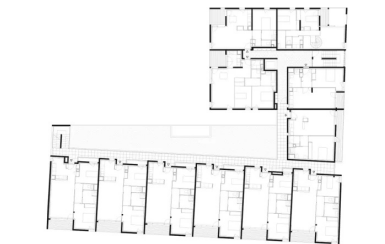
Plan de R+2