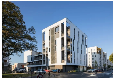
Le volume cubique vertical de l'immeuble plot participe au front bâti de la rue Daniel-Meyer.

Les volumes bâtis sont reliés entre eux par un bâtiment intermédiaire à R+2 qui aménage des percées vers l'intérieur de la parcelle sous forme de liaisons douces. Les niveaux supérieurs sont desservis par de longues coursives équipées d'escaliers à chacune de leurs extrémités : d'une part au cœur de l'immeuble-plot, en lien avec l'ascenseur, et d'autre part, sur le pignon de la barre. La résidence est ainsi dotée de deux entrées : une depuis le hall, l'autre directement depuis la rue.