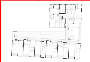
Plan de R+2