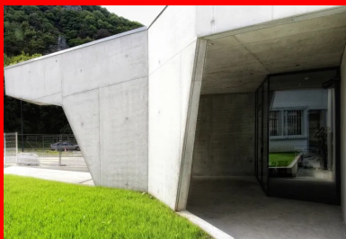
Le porte-à-faux signale l'accès et invite à entrer dans le siège de l'entreprise.

Sur la rue, la façade est animée par tout un jeu de plans décalés qui rappellent les anfractuosités d'une roche. Elle se prolonge vers le parking par un porte-à-faux, qui signale l'accès et invite à entrer dans le siège de l'entreprise. L'ensemble du bâtiment est construit en béton brut coulé en place. Pour les façades, c'est un béton autoplaçant qui a été mis en œuvre dans un coffrage conçu pour avoir un minimum de reprises de bétonnage, afin d'obtenir l'aspect monolithique et sculptural souhaité. Un second voile en béton est coulé à l'intérieur, derrière celui de la façade, sur la hauteur du rez-de-chaussée. L'isolant de 200 mm présent entre les parois de ce double mur se continue au premier étage. Ce système d'isolation continue par l'intérieur supprime ainsi tous les ponts thermiques. La dalle de plancher du premier étage est portée de façade à façade par le voile intérieur du double mur. Le siège de SMBA affiche ainsi les savoir-faire en matière de béton de l'entreprise et sa capacité à relever des défis structurels ou plastiques.