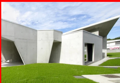
Le porte-à-faux signale l'accès et invite à entrer dans le siège de l'entreprise.

La parcelle occupée par le siège de SMBA a une forme de triangle rectangle, dont l'hypoténuse dessine une ligne courbe longeant la rue du Commandant Lenoir. Un grand hangar existant en occupait une partie importante. Conservé, il est utilisé pour les besoins de stockage de l'entreprise. La pointe de la parcelle étant libre de toute construction, l'architecte a choisi d'y implanter le bâtiment neuf abritant l'accueil, les salles de réunion et les bureaux du siège social. L'espace libre entre le hangar et la rue est aménagé en parking.