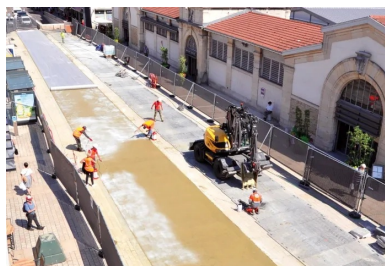
Du premier plan à l'arrière-plan, les différentes étapes du chantier : lissage, pulvérisation du produit de cure, déploiement du géotextile.