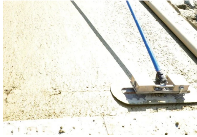
Utilisation d'une taloche à long manche.