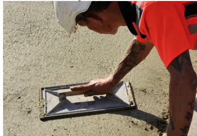
La talochage fin a été réalisé à la main.