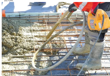
Une aiguille vibrante est utilisée pour chasser les bulles d'air et assurer une bonne compacité.