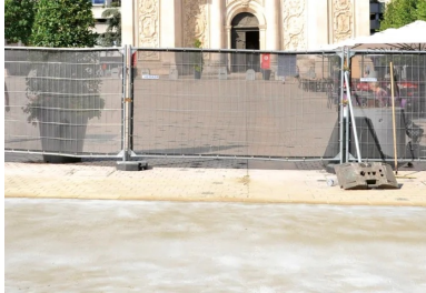
La rue Raugraff est située dans un périmètre historique. Sa rénovation avec du BAC a nécessité l'accord et le suivi des architectes des Bâtiments de France.