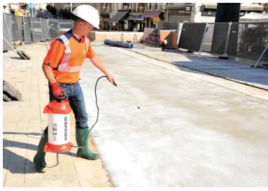
Pulvérisation du produit de cure (Pieri Easy Cure).