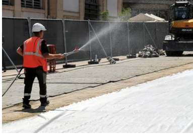
Un géotextile est déployé pour protéger la nouvelle chaussée. But - renforcer encore la prise du béton. Il sera arrosé toutes les heures jusqu'au soir.