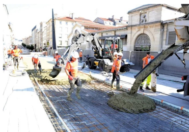
Le béton est délivré directement à la goulotte, puis réparti sur une épaisseur de 21 cm.

Les carottages réalisés par le Cerema-Laboratoire de Nancy ont révélé une couche de forme hétérogène, composée d'une grave traitée en mauvais état dans une zone et de sable stabilisé dans les deux autres. La composition de la couche de fondation varie également, avec cependant deux zones en très bon état constituées de pavés reposant sur un sable stabilisé.