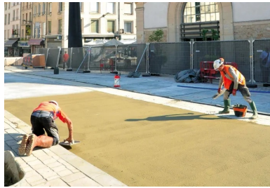
Achèvement des travaux devant l'entrée du marché couvert.

alternance de surfaces poncées et bouchardés reprenant le concept et les motifs déployés sur la place Charles-III, la teinte beige clair (avec traitement de surface et utilisation d'un fixateur) se rapprochant le plus possible de la coloration des pavés situés sur la place. Les Bâtiments de France ont donné leur feu vert.