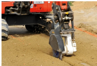
Vérification de l'humidification et de la densité réalisée à l'aide d'une jauge Humboldt HS-5001EZ.

À Montoisson, le BAR a été mis en œuvre par une seule machine à hautes capacités, qui a procédé à différentes opérations en intercalant une couche de fibres de verre - déroulées de bobine et découpées en brins de 6 cm de longueur - entre deux couches d'émulsion de bitume. Les 40 000 m 2 de superficie du chantier de la RD125 ont été traités en deux jours.