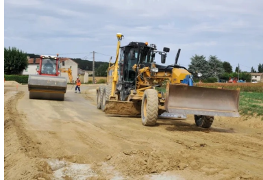
Derrière le malaxeur, la mise en œuvre se poursuit avec le nivellement de la chaussée (à droite) et le compactage du matériau (à gauche).

Sur un tronçon de chaussée préalablement fragmentée, un épandage de liant a été réalisé. Un atelier de retraitement constitué d'un malaxeur Bomag RS 650, alimenté par une citerne d'eau, a procédé au mélange à froid des matériaux « afin d'obtenir, après prise et durcissement , un mélange homogène présentant des caractéristiques mécaniques élevées ». Après vérification de la teneur en eau, une niveleuse asservie à un GPS a effectué un réglage « avec une précision de l'ordre du centimètre », avant l'intervention d'un atelier de compactage , composé d'un rouleau vibrant et d'un compacteur à pneus.