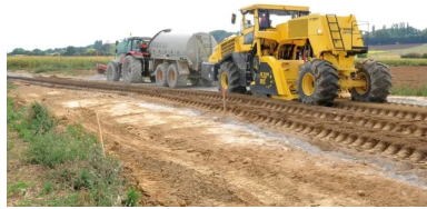
Derrière le malaxeur Bomag RS 650, un technicien vérifie visuellement l'homogénéité du mélange entre le matériau de l'ancienne chaussée et le liant hydraulique, et un autre mesure la teneur en eau du matériau traité.

Objectif : augmenter la sécurité et réduire sensiblement le nombre d'accidents.