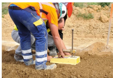
Vérification de l'humidification et de la densité réalisée à l'aide d'une jauge Humboldt HS-5001EZ.

Durée prévue du chantier : cinq mois pour le lot « chaussée », à compter du démarrage, le 1 er juin 2018.