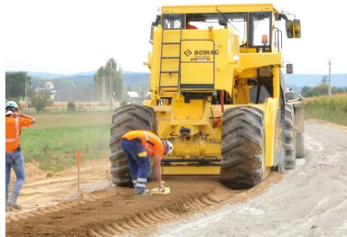
Derrière le malaxeur Bomag RS 650, un technicien vérifie visuellement l'homogénéité du mélange entre le matériau de l'ancienne chaussée et le liant hydraulique, et un autre mesure la teneur en eau du matériau traité.