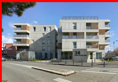
Tous les logements sont dotés de balcons ou de loggias qui forment des avancées ou des espaces en creux, créant des perspectives variées depuis la rue.

Le projet des Carrés de Bellefontaine est composé de 7 plots articulés autour d'un patio central mi-plantaire mi-minéral, à la manière des jardins toulousains, que l'on ne découvre qu'une fois passée la porte cochère. Ici, les petits immeubles forment une sorte de protection à l'espace central très intime de la cour intérieure.