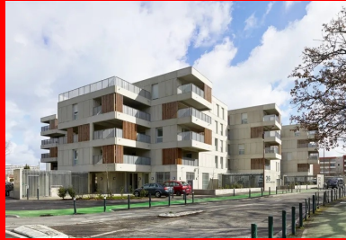
La conception en petits volumes à R+4 introduit une échelle humaine au sein du quartier.

Pour saisir la teneur du projet de l'agence, il semble nécessaire de revenir un instant sur les grands principes qui régissent sa démarche architecturale