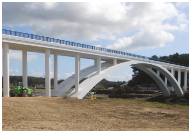
Pont Kerisper après travaux