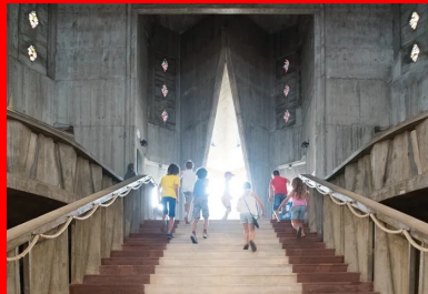
Entrée de l'église Notre-Dame de Royan.