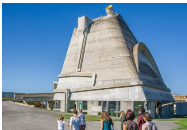
Eglise Saint-Pierre de Firminy (Conception : Le Corbusier, José Oubrenie).

De jeunes créateurs contemporains apportent aussi désormais leur touche personnelle. La ville, faisant sienne la remarque de l'architecte urbaniste Jacques Sbriglio selon lequel « la banalité d'une construction devient sa force d'expression », a en effet créé sa propre marque, « LGM BY », sous laquelle elle encourage des artistes et designers contemporains à proposer leur vision de la cité. Leur cahier des charges : produire des objets déco et art de vivre « tendance », en lien avec l'architecture de la cité balnéaire. C'est le cas chez Oxyo, par exemple.