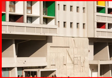
Au pied de la Cité radieuse de Le Corbusier, à Marseille.

La construction des « Bains » en 2008, sur des plans de Jean Nouvel, a participé aussi à l'attraction de la ville devenue internationale. Avec cette superbe piscine toute de béton et de mosaïques blanches et bleues, l'architecte rend hommage à cette luminosité de la ville. « Les Bains » enfoncent le clou de la beauté avant-gardiste retrouvée, soutenue il est vrai, par une double politique de rénovation et de communication entamée dès les années 1990. Avec en point culminant, les fêtes de 2017, organisées en l'honneur des 500 ans de la ville.