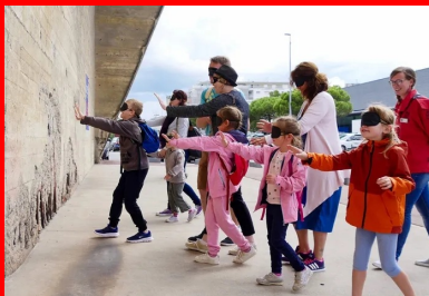
Dans le cadre de la visite guidée de la base sous-marine de Saint-Nazaire avec les enfants : le parcours sensoriel et ludique « Sensations béton ».