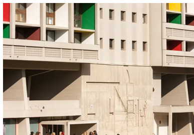
Au pied de la Cité radieuse de Le Corbusier, à Marseille.