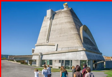
Eglise Saint-Pierre de Firminy (Conception : Le Corbusier, José Oubré).

De jeunes créateurs contemporains apportent aussi désormais leur touche personnelle. La ville, faisant sienne la remarque de l'architecte urbaniste Jacques Sbriglio selon lequel « la banalité d'une construction devient sa force d'expression », a en effet créé sa propre marque, « LGM BY », sous laquelle elle encourage des artistes et designers contemporains à proposer leur vision de la cité. Leur cahier des charges : produire des objets déco et art de vivre « tendance », en lien avec l'architecture de la cité balnéaire. C'est le cas chez Oxyo, par exemple.