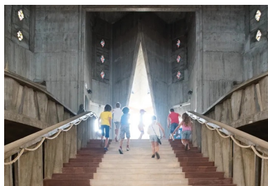
Entrée de l'église Notre-Dame de Royan.

« Le travail de prise de conscience a pris du temps, mais le message se généralise », poursuit Charlotte de Charrette. Le béton est passé du stade de « has been » à celui de « vintage ». « Aujourd'hui, les agences immobilières, les hôtels et autres lieux d'hébergements jouent la carte du patrimoine et du design des années de la reconstruction. On ne vient plus seulement à Royan pour la vue sur la mer, l'éta. On y vient toute l'année, pour la ville et pour se plonger quelque temps avec délice dans l'atmosphère des années 60. »