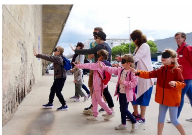
Dans le cadre de la visite guidée de la base sous-marine de Saint-Nazaire avec les enfants : le parcours sensoriel et ludique « Sensations béton ».