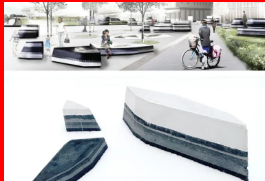
« L'archipel lutétien », Nanterre, concours 2018

Pour Gilles Brusset, il semble à nouveau important de rappeler l'histoire géographique du lieu, par contraste encore avec le contexte : un urbanisme déterminé par les infrastructures de transport, déconnecté de son territoire. En posant des blocs composés de finies couches de différents bétons teintés dans la masse, on voit apparaître ce qu'il appelle « L'archipel lutétien ». Ce sont quarante-cinq îles en forme de losange plus ou moins étiré, disposées à des niveaux variables mais dont les strates de même teinte se retrouvent alignées et reconstituent les horizons. On est invité à s'y reposer.