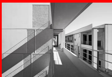
Bâtiment Aziyade - 92 logements étudiants à La Rochelle, (MOA : CROUS de Poitiers)

Oui et il faut savoir limiter cette phase-là. Nous comptons trois mois de pré-synthèses. On ne coule rien avant de l'avoir terminé, contrairement au chantier en traditionnel où l'on peut faire la mise au point jusqu'au dernier moment. On est obligé de préparer une pré-synthèse réelle et massive dans laquelle tout le monde travaille ensemble. Une fois terminée, la préfabrication est lancée et ce n'est plus qu'un contrôle de suivi. C'est la clé et la garantie du bon fonctionnement. C'est là où l'on gagne sur tous les plans. C'est un véritable travail de décision, d'arbitrage et de simulation. Le chantier ne devient plus qu'une période de contrôle qui est de fait plus court. Les aléas sont réduits. On arrive à éliminer les problèmes de mise au point, et le chantier devient presque une formalité. L'enjeu est là pour la construction de logements neufs, puisque cela ne concerne pas la réhabilitation.