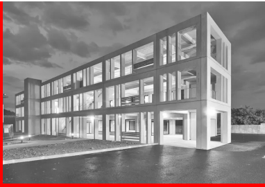
Bâtiment Aziyadé - 92 logements étudiants à La Roche-sur-Yon (MOA : CROUS de Poitiers)