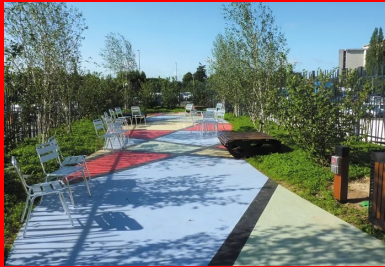
Cet espace de détente de 80 m2 en béton coloré et finement sablé arbore un arlequin rouge, noir, jaune et bleu en béton lissé, spatulé et gravé.

Couronné aux Victoires du Paysage, le jardin compte parmi les tout premiers de ce type en France.