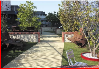
Le jardin est composé de plusieurs espaces délimités par des murets d'un mètre de hauteur, travaillés en pierre de Caen et en brique.