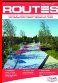
Cet article est extrait de Routes n°134

Maitrise d'ouvrage : Centre de lutte contre le cancer François Baclesse, à Caen (14) - Maitrise d'œuvre : Atelier de paysage Zenobia - Entreprise mandataire : Minéral Service Lot n°2 Maçonnerie et revêtements de sol - Fournisseur du béton : Cemex - Fournisseur du ciment : Calcia - Fournisseur du désactivant : Chryso - Pépinéristes : Vivaces de l'Odon, Jardin Service et Pépinières Soupe