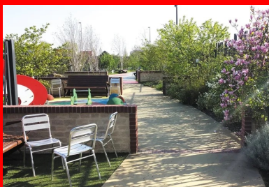
une allée centrale dessert l'ensemble du jardin pour finir dans une impasse.

Nous étions aux portes du centre hospitalier, ce qui imposait un taux de poussière égal à zéro ! Toutes les coupes ont été faites à l'eau. Nous avons également planifié les travaux pour ne pas faire de bruit durant les heures de traitement des malades. Il fallait canaliser le plus possible les nuisances. »