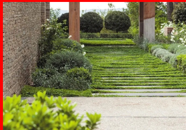
A l'autre extrémité du jardin, l'accès aux espaces de vie.