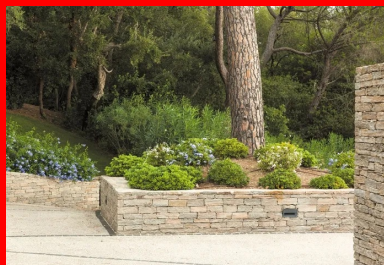
Les arbres classés ont été préservés et mis en valeur.

Ensuite, pour le choix des coloris et des textures. La gamme à présenter aux clients est large, et il est rare qu'ils ne trouvent pas leur bonheur. Enfin, pour la rapidité de mise en œuvre, la tenue en pente et la facilité d'entretien (avec l'utilisation de produit antitache). Et donc, au final, avec un bon rapport qualité-prix. »