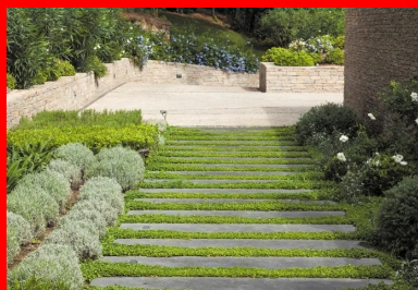
Originalité : un escalier végétalisé aux marches allongées menant à la résidence.

La société MB Constructions est intervenue sur cette chaussée en courbe, une fois les autres travaux achevés. L'entreprise a mis en œuvre un béton à la tonalité méditerranéenne, avec un granulat couleur ocre gris (6/16 de la Durance) sur une surface de 960 m 2 et une épaisseur de 12 cm. Largeur de la voie : 4,50 m.