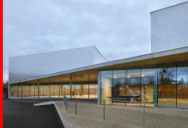
Vue depuis le parvis.

Son modèle pédagogique est fondé sur une approche multiculturelle, une ouverture très grande aux langues, ainsi que sur l'autonomie de l'enfant et une place importante laissée aux parents dans l'école.