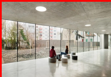
Le hall vitré sur le jardin dessert tous les vestiaires.

Conçu par l'agence d'architecture Dominique Coulon & associés, le centre sportif des Droits de l'homme établit un dialogue avec l'école européenne. « Notre projet prolonge la logique des fragments déjà mise en œuvre pour le bâtiment de l'école européenne. Les volumes des deux salles sont dissociés et pivotés, ce qui permet de placer la grande salle dans une situation idéale. Perpendiculaire à la rue et implantée en limite nord de la parcelle, sa position minimise l'impact du bâtiment dans le site. Toute la profondeur de la parcelle est utilisée, le bâtiment offre un linéaire plus court vers la rue, il donne plus de porosité vers le paysage. Le hall est transparent. Il laisse voir depuis le parvis le bois à l'arrière de la parcelle. Une couronne programmatique, accueillant les vestiaires et locaux annexes, entoure les deux salles, tout en ménageant des vues à la fois vers l'extérieur et entre elles », explique l'architecte Dominique Coulon.