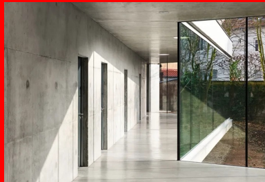
Le hall vitré sur le jardin dessert tous les vestiaires.

Pour répondre aux besoins de cet important équipement scolaire et des habitants du quartier, la ville de Strasbourg a décidé de construire un centre sportif. Son programme comprend une salle multisport et une salle polyvalente, pouvant accueillir des manifestations autres que sportives. À cela s'ajoutent des vestiaires, une infirmerie et un logement de fonction.