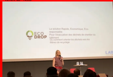
cement lab - Ecodrop