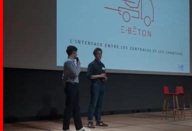
cement lab - E beton