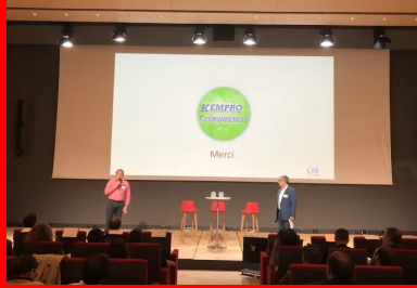
cement lab - Kempro Environment