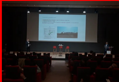
cement lab - yicat