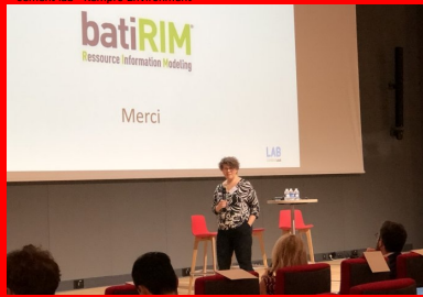
cement lab - BatiRim