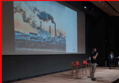
cement lab - water horizon