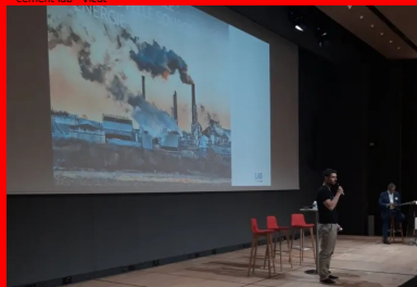
cement lab - water horizon