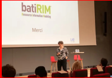
cement lab - BatiRim