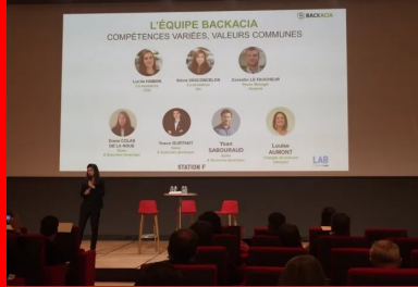
cement lab - backacia