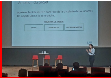
cement lab - calcia