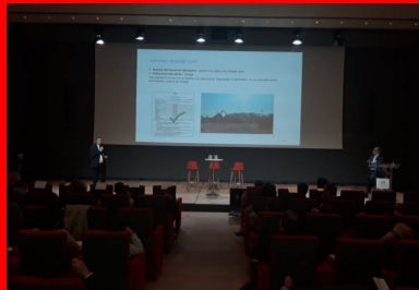
cement lab - yicat