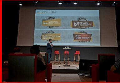
cement lab - cycle up