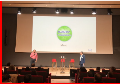
cement lab - Kempro Environment