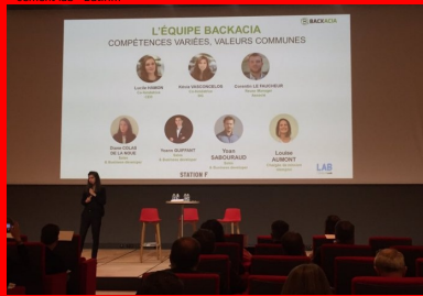
cement lab - backacia