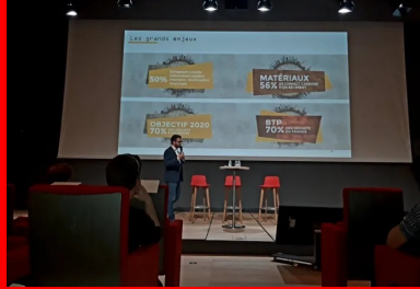
cement lab - cycle up