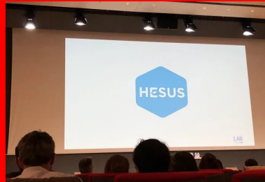
cement lab - Hesus