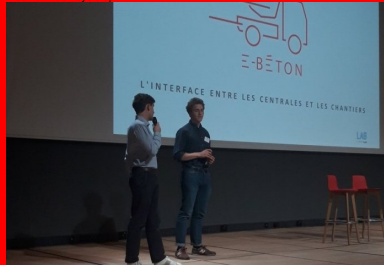
cement lab - E beton