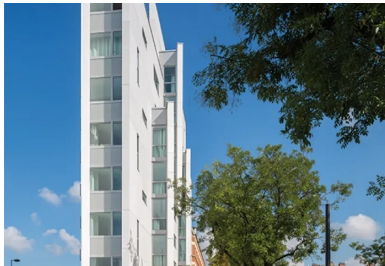
Un jeu de lames en béton comme signal dans la ville.

Ancré sur une étroite parcelle triangulaire dominant la bretelle d'accès du boulevard périphérique et les voies ferrées de la ligne Montparnasse, ce bâtiment en proue est l'œuvre de l'Atelier Jacques Ripault. Pour déjouer par une double approche plastique et technique les difficultés de la parcelle, l'architecte mobilise toutes les capacités du béton fibré à ultra hautes performances pour exprimer le dessin de son projet. Caractérisé par une terrasse en vigie face à la ville et par l'opalescence légère de son rez-de-chaussée, l'édifice accueille une résidence de 67 logements étudiants. Dominant les voies ferrées du haut de ses circulations, l'architecture offre des vues panoramiques inédites sur la ville.