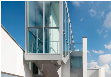
La terrasse et ses cadrages.

Si l'émergence d'un escalier en partie haute est un bel appel à la lumière, le bâtiment, selon ses orientations, se protège et s'ouvre sur l'extérieur dans un jeu de fines lames et d'ouïes qui abritent l'espace des chambres sous la peau lisse, blanche et veloutée du béton . Au sud-ouest, l'édifice est en appui sur le mur acoustique qui s'affirme tel un contrefort le long des voies ferrées. Ici, la lame très épaisse s'avance en porte-à-faux pour amortir le bruit, protégeant ainsi les chambres exposées au sud en adoucissant la proue qu'elle embrasse. Sur le versant sud-est, côté ville, les studios d'étudiants sont éclairés par des plans successifs d'un effeuillage décalé d'étage en étage en ouvrant des vues latérales ou frontales. Comme autant d'appels visuels vers l'extérieur, l'alternance de failles hautes et verticales et de baies propose ainsi aux étudiants des cadrages choisis.