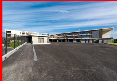
La composition en U minimise l'impact acoustique de la voie ferrée et protège les espaces extérieurs des vues depuis la rue.

L'établissement est composé selon une figure en U offrant ses pignons en vis-à-vis des voies ferrées. Cette disposition minimise l'impact acoustique des trains sur les locaux d'enseignement et protège la cour de récréation et l'aire d'évolution sportive des vues depuis la rue. Le positionnement des immeubles sur pilotis, avec le plancher du rez-de-chaussée à 1,30 m au-dessus du sol naturel, résulte pour sa part des prescriptions du Plan de prévention des risques inondations. Peu perceptible mais bien présente, la surélévation du rez-de-chaussée préserve les possibilités d'écoulement des eaux en cas de crue. Elle est gérée au niveau de l'entrée principale par un emmarchement et, de part et d'autre du parvis, par l'intégration dans le sol de rampes assurant l'accessibilité des personnes à mobilité réduite. Les murs en béton gris coffrés à la planche du local vélo et un grand portique en béton blanc complètent la mise en scène de l'accès au bâtiment.