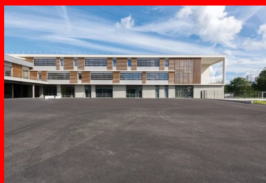
Peintes ou revêtues de bois ligné, les façades courantes s'inscrivent entre des éléments horizontaux en béton blanc.

Grâce à son gabarit urbain, l'établissement est perceptible depuis le parvis de la gare. Sa volumétrie générale est unifiée par un rez-de-chaussée faisant socle dans lequel sont aménagés les espaces d'administration, de restauration et d'étude. Ce niveau supporte les deux éléments majeurs de la composition, d'une part, l'aile nord dont les deux étages regroupent 21 salles de classe disposées orthogonalement à la voie ferrée et, d'autre part, le bâtiment d'entrée constitutif de la base du U. Faisant face au parvis, ce dernier est habillé d'une trame de brise-soleil verticaux qui gèrent l'ensoleillement du hall sur lequel donne la mezzanine du CDI. Il se poursuit par une aile abritant dans ses étages le foyer des enseignants et des logements.