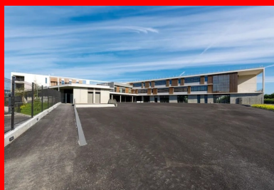
La composition en U minimise l'impact acoustique de la voie ferrée et protège les espaces extérieurs des vues depuis la rue.

L'établissement est composé selon une figure en U offrant ses pignons en vis-à-vis des voies ferrées. Cette disposition minimise l'impact acoustique des trains sur les locaux d'enseignement et protège la cour de récréation et l'aire d'évolution sportive des vues depuis la rue. Le positionnement des immeubles sur pilotis, avec le plancher du rez-de-chaussée à 1,30 m au-dessus du sol naturel, résulte pour sa part des prescriptions du Plan de prévention des risques inondations. Peu perceptible mais bien présente, la surélévation du rez-de-chaussée préserve les possibilités d'écoulement des eaux en cas de crue. Elle est gérée au niveau de l'entrée principale par un emmarchement et, de part et d'autre du parvis, par l'intégration dans le sol de rampes assurant l'accessibilité des personnes à mobilité réduite. Les murs en béton gris coffrés à la planche du local vélo et un grand portique en béton blanc complètent la mise en scène de l'accès au bâtiment.