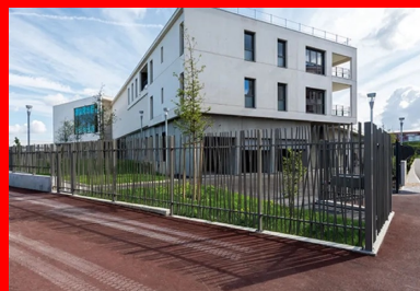
Le système structurel associe planchers, murs de refends intérieurs et façades porteuses coulés en place en béton blanc autoplaçant.

Fortement marquée par la volonté du département des Yvelines de réduire les dépenses énergétiques de ses équipements publics, la construction du nouveau collège a fait l'objet d'une démarche de haute qualité environnementale. Orienté pour maximiser les apports solaires, il combine des dispositifs aujourd'hui de plus en plus fréquemment mis en œuvre dans les réalisations vertueuses en matière de développement durable : toitures végétalisées, système de récupération des eaux pluviales, ventilation double flux, planchers chauffants et isolation renforcée. Mais, c'est au niveau des fondations que la réalisation présente un caractère véritablement innovant et spectaculaire.