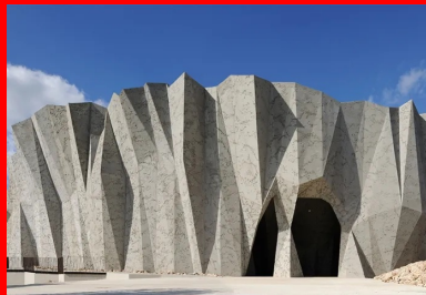
L'écriture architecturale de la réplique réinterprète le relevé 3D de la caverne et sa triangulation.

Garants et dépositaires de ce patrimoine unique, l'État, le conseil régional de Rhône-Alpes et le conseil général de l'Ardèche se sont mobilisés pour conduire ce projet de restitution et d'interprétation, lançant une consultation en 2009. Le site choisi est à la hauteur de la grotte, 12 hectares recouverts de chênes verts, au Razal, sur les hauteurs de Vallon-Pont-d'Arc. Il offre à son extrémité sud des vues sur la vallée et les contreforts de l'Ardèche au même titre que la cavité d'origine.