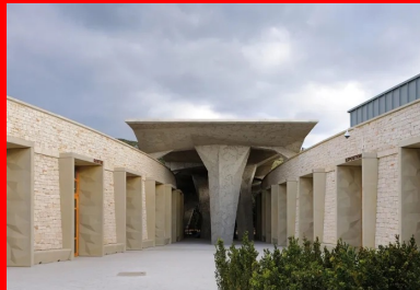
Le pôle accueil est traité comme une étroiture entre deux murs courbes habillés de pierre d'orgnac, à l'abri d'un grand auvent.

L'agence d'architecture Fabre et Speller, associée avec l'Atelier 3A, lauréats du concours , ont considéré la qualité de ce paysage avec grand soin, cherchant à l'exprimer au travers d'un projet où Nature et Architecture s'accordent. Du pont sur l'Arche, on n'aperçoit que les « falaises reconstituées » de la réplique, vaisseau amiral du projet. Il faut prendre de la hauteur pour découvrir la véritable empreinte, presque naturaliste, du projet dans le paysage. La Caverne du Pont-d'Arc n'est pas un bâtiment monolithique mais une structure éclatée en cinq pôles, entre lesquels on chemine sur des sentiers. La combinaison des itinéraires laisse au visiteur le choix et rythme le parcours au milieu des chênes et des buis centenaires. Depuis le parking, un premier effet de clairière invite le visiteur vers l'entrée. Ce premier seuil longe une étroiture entre deux murs courbes à l'abri d'un grand auvent.