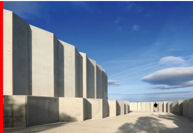
On accède à la grotte latéralement, par une descente en rampe, accompagné par des parois béton de panneaux préfabriqués à coffrage intégré.

Nous avons tenté d'avoir la même concentration artistique que celle des artistes de la grotte, et avons cherché à l'extérieur à traduire de façon abstraite la triangulation du relevé 3D des parois, mettant en œuvre la même technique de béton projeté qu'à l'intérieur. Seule, l'utilisation de ce matériau apportait la masse et la résonance d'une véritable grotte. En façade , le challenge a été de réaliser une triangulation qui ne soit pas trop fine pour être perceptible de loin. Associées aux plis, aux fissures, les facettes communiquent avec la nature environnante. De loin et avec le soleil, les 100 m de long et 14 m de haut du bâtiment deviennent une véritable falaise reconstituée. « Comme dans la grotte d'origine, l'entrée est plein sud, à l'opposé du point d'arrivée du sentier. On y accède latéralement par une descente en rampe. Les architectes en ont profité pour préparer les visiteurs à la puissance artistique des dessins, comme si chaque pas faisait remonter le temps et mettait en condition sensorielle. Le parcours devient initiatique. On descend accompagné par des parois en béton, constituées de panneaux préfabriqués à coffrage intégré. Lisse, leur aspect de surface est presque glacé. Leur pose en lignes brisées, comme dans un canyon, trace une triangulation progressive d'abord simplement en deux dimensions.