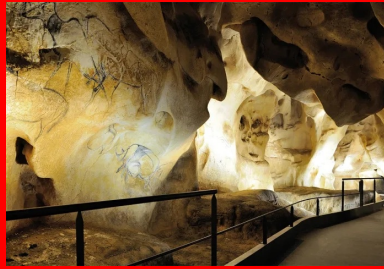
À l'intérieur, des centaines d'armatures ont été soudées à la main pour recevoir un béton projeté puis un mortier paysager.

Nous avons tenté d'avoir la même concentration artistique que celle des artistes de la grotte, et avons cherché à l'extérieur à traduire de façon abstraite la triangulation du relevé 3D des parois, mettant en œuvre la même technique de béton projeté qu'à l'intérieur. Seule, l'utilisation de ce matériau apportait la masse et la résonance d'une véritable grotte. En façade , le challenge a été de réaliser une triangulation qui ne soit pas trop fine pour être perceptible de loin. Associées aux plis, aux fissures, les facettes communiquent avec la nature environnante. De loin et avec le soleil, les 100 m de long et 14 m de haut du bâtiment deviennent une véritable falaise reconstituée. « Comme dans la grotte d'origine, l'entrée est plein sud, à l'opposé du point d'arrivée du sentier. On y accède latéralement par une descente en rampe. Les architectes en ont profité pour préparer les visiteurs à la puissance artistique des dessins, comme si chaque pas faisait remonter le temps et mettait en condition sensorielle. Le parcours devient initiatique. On descend accompagné par des parois en béton, constituées de panneaux préfabriqués à coffrage intégré. Lisse, leur aspect de surface est presque glacé. Leur pose en lignes brisées, comme dans un canyon, trace une triangulation progressive d'abord simplement en deux dimensions.