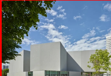
Le pivotement géométrique des volumes, qui correspondent aux éléments caractéristiques du programme, façonne la plastique générale de l'édifice.