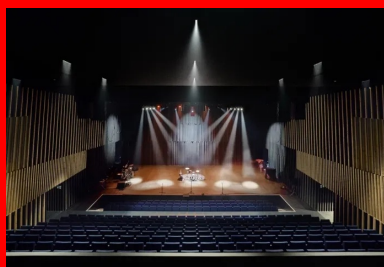
Vue sur la salle de spectacle.

Toute la structure du bâtiment, assez complexe avec ses porte-à-faux et ses décalages géométriques, est construite en béton coulé en place. L'enveloppe est réalisée avec des panneaux préfabriqués de type mur à coffrage intégré, polis ou bouchardés en usine. L'architecte et la maîtrise d'ouvrage souhaitaient que les joints entre panneaux ne soient pas visibles. Après plusieurs essais, l'entreprise de gros œuvre a trouvé une solution, qui efface la présence des joints. Cela donne force et unité aux parois de l'enveloppe de l'édifice.