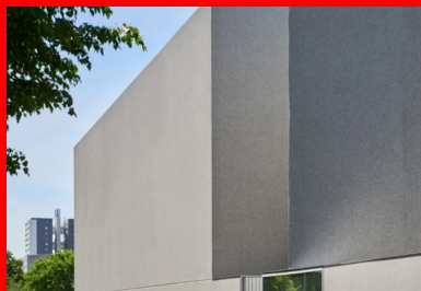
L'enveloppe du bâtiment est rythmée par les grands plans vitrés et les parois verticales en béton gris poli ou bouchardé. Des éclats de miroir sont incorporés au béton. Ils scintillent sous le soleil et animent les façades de façon changeante et inattendue.

Le jeu des volumétries simples , qui composent l'édifice, ne cherche pas à rivaliser avec les immeubles de grande hauteur alentour. Il s'en détache sans ostentation par sa propre géométrie. Sur le socle rectangulaire du rez-de-chaussée, le volume de la grande salle de répétition, appelée le « Belvédère », vient en porte-à-faux sur la place. Il se décale en diagonale vers le nord-ouest et regarde en direction de la mairie, mettant ainsi en relation les deux bâtiments institutionnels. Son voisin, qui abrite deux studios de répétition, se tourne à l'inverse vers le nord-est. L'un et l'autre se décalent et pivotent en avant-plan du volume de la salle de spectacle, qui pour sa part se prolonge en porte-à-faux sur le côté ouest et signale ainsi sa présence sur l'espace public.