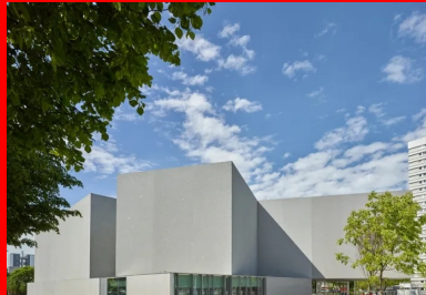
Le pivotement géométrique des volumes, qui correspondent aux éléments caractéristiques du programme, façonne la plastique générale de l'édifice.

Comme ce fut souvent le cas, le quartier s'est dégradé au fil des années et souffrait d'une perception négative, malgré d'incontestables atouts comme sa situation au cœur de la métropole lilloise, sa bonne desserte par les transports en commun et la présence de vastes espaces verts...