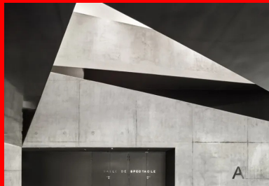
Le hall se dilate verticalement par un grand vide ascensionnel qui met en relation tous les éléments du programme.

Le jeu des contrastes entre l'aspect brillant de la laque et celui mat du béton, les variations des reflets ou de la lumière accompagnent le développement vertical continu des parois qui se plient, se déplient, se remplissent dans un mouvement ascensionnel et caractérisent ce véritable foyer spatial. Le mouvement de la matière et celui des usagers se répondent créant des perceptions, des perspectives, des points de vue changeants, dynamiques, inattendus.