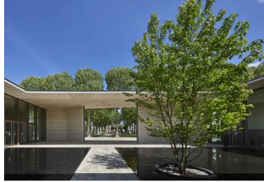
Transparence entre la place et le cloître.