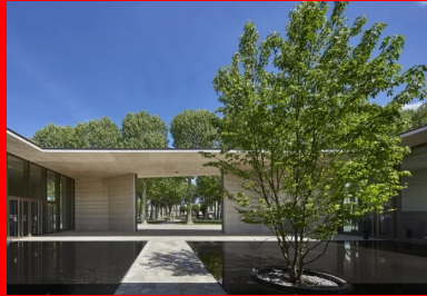
Transparence entre la place et le cloître.