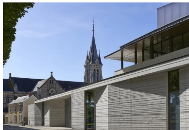
Aux côtés de l'église, le béton instaure un dialogue des matières avec l'existant.

La vision nocturne de l'émergence du volume de la salle de spectacle au-dessus de l'architecture sobre des murs en béton blanc a dicté le nom de cet équipement où la texture du béton et une rare qualité dans sa mise en œuvre sont un excellent augure de pérennité. « L'idée d'utiliser le béton est arrivée assez naturellement », poursuit l'architecte. « Nous souhaitons un matériau qui se rapporte aux maçonneries de meulière des maisons voisines par des granulats d'un léger brun jaune et nous tenions à donner une texture à ce béton planche. » En façade , les stries horizontales des coffrages ont permis des variations de nu qui donnent à la matière une belle irrégularité qui n'est pas sans rappeler la stéréotomie des murs de l'église voisine. Plus que par un registre formel, c'est donc par son échelle et la matière de ses façades que l'architecture contemporaine instaure ainsi, mine de rien, un dialogue subtil avec ce bâtiment néo-gothique de la fin du XIX e siècle.