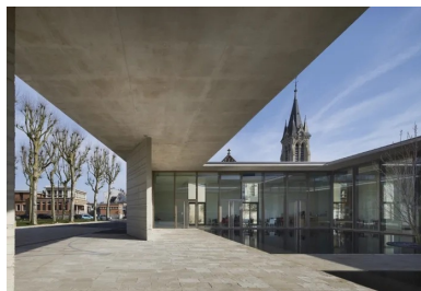
Les débords de toiture et la présence du miroir d'eau soulignent la géométrie d'une architecture où les vides et les effets de filtre sont une composante essentielle.

« Comme dans d'autres projets du Studio, le paysage et les espaces vides qui règlent la composition sont au cœur de la conception », ajoute l'architecte. La terrasse, le parvis, le gué de traversée du bassin sont autant de séquences minérales qui tissent avec la place une relation étroite en laissant une part à la contemplation. Au fil de transparences et de filtres, des accointances se nouent ; des ouvertures créent des cadrages quand la terrasse en béton du foyer et le parvis pavé s'étirent vers la ville, comme à la rencontre de la végétation. Au centre du patio, le miroir d'eau réfléchit le ciel, la flèche de l'église et les arbres environnants.