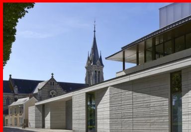
Aux côtés de l'église, le béton instaure un dialogue des matières avec l'existant.

La vision nocturne de l'émergence du volume de la salle de spectacle au-dessus de l'architecture sobre des murs en béton blanc a dicté le nom de cet équipement où la texture du béton et une rare qualité dans sa mise en œuvre sont un excellent augure de pérennité. « L'idée d'utiliser le béton est arrivée assez naturellement », poursuit l'architecte. « Nous souhaitons un matériau qui se rapporte aux maçonneries de meulière des maisons voisines par des granulats d'un léger brun jaune et nous tenions à donner une texture à ce béton planche. » En façade , les stries horizontales des coffrages ont permis des variations de nu qui donnent à la matière une belle irrégularité qui n'est pas sans rappeler la stéréotomie des murs de l'église voisine. Plus que par un registre formel, c'est donc par son échelle et la matière de ses façades que l'architecture contemporaine instaure ainsi, mine de rien, un dialogue subtil avec ce bâtiment néo-gothique de la fin du XIX e siècle.