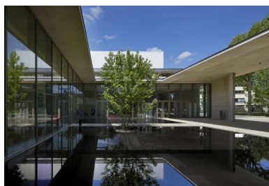
Les débords de toiture et la présence du miroir d'eau soulignent la géométrie d'une architecture où les vides et les effets de filtre sont une composante essentielle.

Dans cet enclos fermé par des paravents de béton, où le cloître du patio amplifie l'espace public, l'image d'un lieu méditatif prévaut délibérément sur celle d'un équipement républicain. L'architecte organise ainsi les composantes du programme autour d'un espace intériorisé et des transparences accentuent les effets de continuité des sous-faces de plafonds en béton, entre l'intérieur et l'extérieur. La couverture du cloître est constituée comme un plancher nervuré en béton coulé en place. Sa sous-face présente un plan horizontal continu en béton au parement architectonique brut de teinte ocre-pierre à l'aspect glacé. Lorsque l'on entre à l'intérieur de l'édifice, le foyer d'accueil, le foyer haut et leurs circulations généreusement ouvertes sur l'extérieur distribuent, sur deux niveaux, une grande salle de spectacle, modulable, un petit amphithéâtre plus intime de 126 places, une salle d'exposition, une cafétéria et les espaces techniques et logistiques nécessaires à ce type d'équipement.