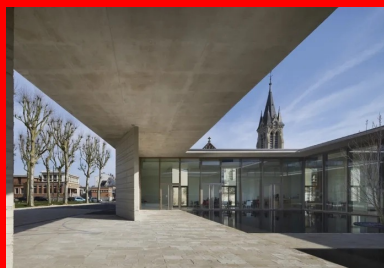
Les débords de toiture et la présence du miroir d'eau soulignent la géométrie d'une architecture où les vides et les effets de filtre sont une composante essentielle.

« Comme dans d'autres projets du Studio, le paysage et les espaces vides qui règlent la composition sont au cœur de la conception », ajoute l'architecte. La terrasse, le parvis, le gué de traversée du bassin sont autant de séquences minérales qui tissent avec la place une relation étroite en laissant une part à la contemplation. Au fil de transparences et de filtres, des accointances se nouent ; des ouvertures créent des cadrages quand la terrasse en béton du foyer et le parvis pavé s'étirent vers la ville, comme à la rencontre de la végétation. Au centre du patio, le miroir d'eau réfléchit le ciel, la flèche de l'église et les arbres environnants.