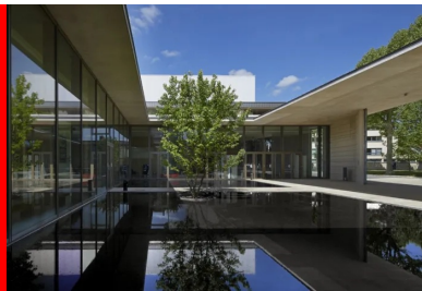
Les débords de toiture et la présence du miroir d'eau soulignent la géométrie d'une architecture où les vides et les effets de filtre sont une composante essentielle.