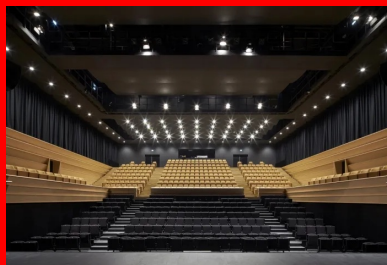
La grande salle de spectacle.

« Cette option de mise en œuvre nous a demandé de procéder à de nombreux essais avec l'entreprise. Comme la texture tend à accentuer les ombres, il ne fallait pas que le béton soit trop blanc », précise l'architecte.