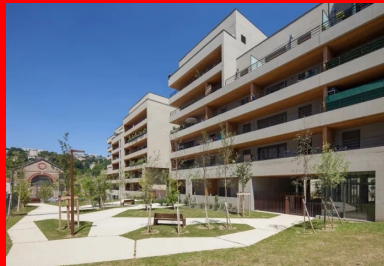
Le bâti est adossé à une large emprise piétonne végétalisée, descendant depuis la plateforme ferroviaire de Perrache.

Dans les parties supérieures, les façades sont teintées par une lasure variant du sable ocre au doré en fonction de la lumière. La trace des matrices architectoniques utilisées lors du coulage apporte une finition structurée aux parements. Les vibrations visuelles qui en découlent sont renforcées par l'accumulation du produit teintant dans les creux et les aspérités du béton matricé.