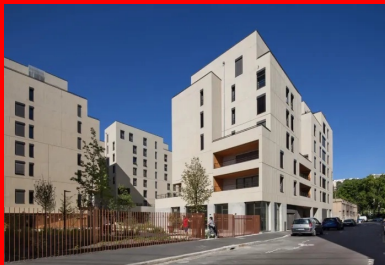
Dense et poreux, l'îlot est composé d'immeubles alignés sur rue.

Le plan accorde ainsi une attention particulière à la place du piéton en réinterprétant l'esprit des fameuses traboules du vieux Lyon, des passages étroits, généralement couverts, qui permettent de circuler d'un immeuble à l'autre et d'accéder aux logements par des cours intérieures. Il ne s'agit cependant que d'une réinterprétation car ici, les nombreuses césures ménagées dans le bâti sont larges et aérées. Ainsi, les porches et les placettes couvertes sont dilatés par des espaces de stationnement pour les vélos, des devantures de commerce ou d'activité et des placettes intérieures.