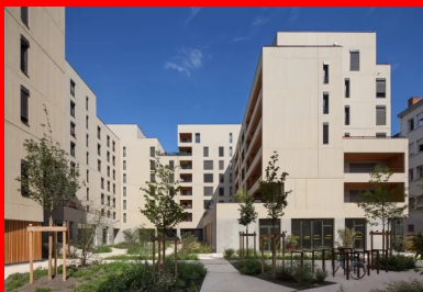
Au cœur de l'opération, un jardin dessert les halls d'accès et les locaux annexes.

Ainsi, tous les lots sont équipés de loggias ou de terrasses, traitées en fonction de l'orientation et du contexte urbain des façades. C'est pourquoi les prolongements extérieurs sont nombreux et étirés face au jardin, tandis qu'ils sont plus limités côté rues. Les plans intérieurs séparent une partie jour donnant sur les loggias et une partie nuit desservie par un couloir. Quatre-vingts pour cent des logements sont traversants ou multi-orientés et, pour la plupart, équipés de salles de bains éclairées naturellement. Les cuisines ouvrent sur les salons, tout en pouvant être isolées dans la partie accession afin de répondre à la variété des demandes culturelles.