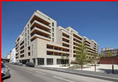
Une architecture homogène unifie 95 logements en accession et 62 logements sociaux.

Deux grandes figures, mises en relation par de multiples liens, articulent le parti d'aménagement. D'une part, une large emprise piétonne végétalisée, descendant en degrés de la plate-forme ferroviaire jusqu'aux berges de la rivière situées 6 m plus bas. D'autre part, un îlot dense et poreux, composé d'immeubles alignés sur rue.