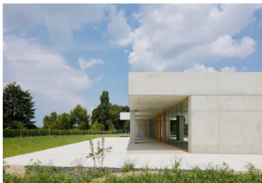
Le volume se creuse pour aménager des lieux de vie extérieurs protégés du soleil et des intempéries par les avancées de toiture.

Pour éviter aux enfants de l'école Roger Balan de devoir traverser la ville afin de rejoindre les locaux des activités périscolaires et la cantine, la ville de Saint-Marcel, voisine de Chalon-sur-Saône, a fait construire un nouvel équipement destiné à remédier à cette situation. Ce nouvel édifice abrite deux ateliers pour l'accueil périscolaire et un restaurant scolaire destinés aux enfants de maternelle et d'élémentaire de l'école Roger Balan située en face, de l'autre côté de la rue de Breuil.