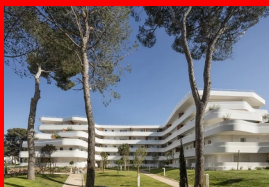
Les garde-corps des balcons filants s'enroulent autour de la façade et ondulent.

Au final, l'œil ne retient qu'une superposition de larges bandes qui ondulent et créent des variations dans leurs superpositions. Décrochements et gradins rappellent le massif montagneux avoisinant et, plus largement, les traditionnelles restanques.