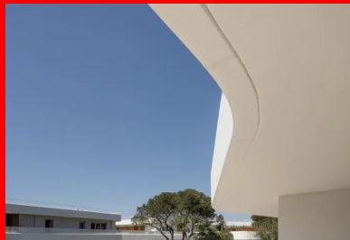
Ombres portées des balcons filants protégeant les vitrages d'un ensoleillement direct.

La pinède environnante étant l'un des points forts du site, chaque pin disparu a été remplacé pour recréer, à terme, un environnement boisé aussi dense qu'à l'origine. Reste à espérer que cette opération influence, à terme, la carte d'identité architecturale du quartier et que cette zone préservée devienne un lieu de référence en termes de confort de vie, où nature et construction s'unissent pour rimer avec réussite.