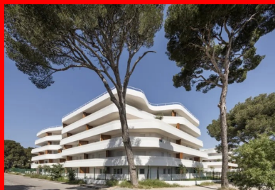
De loin, les garde-corps, composés de béton et de métal, se lisent comme des rubans blancs homogènes.

L'implantation des deux bâtiments, quasi circulaire, avait pour quadruple avantage de démultiplier le linéaire de façade disponible, d'optimiser l'accès à la lumière naturelle, de créer un vaste espace central aménagé en jardin et de minimiser les vis-à-vis en éloignant au maximum les façades se faisant face. À terme, les plantations de ce large patio offriront une intimité supplémentaire. De plus, les accès aux halls des deux bâtiments étant aménagés au centre de la parcelle, les habitants profitent quotidiennement de ce cœur végétal.