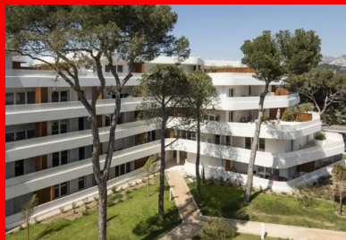
L'aménagement paysager de l'intérieur de l'îlot associe les pins qui ont été préservés à de nouvelles plantations d'espèces endogènes.

Les larges balcons filants, se transformant parfois en terrasses très généreuses, sont le vrai point fort de ce programme d'accession, plutôt banal en termes de matériaux et d'équipements déployés dans les appartements. Cuisines non équipées, revêtements de sol neutres, peinture murale et sanitaires blancs laissent toute latitude à la personnalisation de cet habitat. Ce sont bien l'étendue de ses espaces extérieurs et la qualité de son environnement qui requalifient ici chaque logement pour en faire un espace privilégié. Chacun peut ainsi déambuler entre intérieur et extérieur, quelle que soit la pièce dans laquelle il se trouve, excepté les sanitaires et salles de bains.