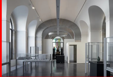
Vue sur une salle d'archéologie. La présence de la lumière naturelle et les matériaux mis en œuvre, comme le béton ciré au sol, caractérisent l'ambiance des lieux.

Après quatre années de fermeture pour travaux de rénovation, le musée des Beaux-Arts et d'Archéologie de Besançon, a rouvert ses portes le 16 novembre 2018. Installé depuis 1843 dans la nouvelle halle aux grains, conçue par l'architecte Pierre Marnotte (1797-1882). Il a fait l'objet d'une importante réhabilitation dirigée par l'architecte Adelfo Scaranello. Les collections d'art et d'archéologie cohabitent avec les activités commerciales de la halle, jusqu'en 1883, où le musée prend possession de la totalité du bâtiment.