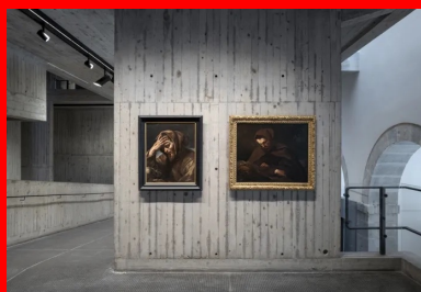
Un musée à vivre où l'on découvre les œuvres au fil des parcours proposés.

Le travail effectué sur les sources de lumière du jour met en valeur l'architecture du lieu et ses parties. La lumière naturelle agrément les espaces, les parcours, les articulations. Elle souligne par sa présence la muséographie et la scénographie conçues par l'architecte.