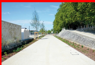
Réaménagées, les berges de la rive droite - notamment la plage des célestins - sont devenues un « secteur d'animations permanentes » avec des activités de loisirs et des jeux d'eau.

« Le projet devait recevoir l'aval de l'Architecte des Bâtiments de France (ABF), poursuit-il. Dans ce but, plusieurs options ont été privilégiées : utilisation de matériaux bruts et d'origine locale, choix d'une teinte claire pour le béton, absence d'effets de calepinage , planimétrie... »