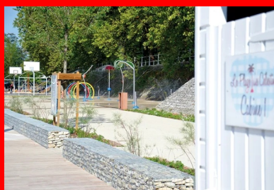
Réaménagées, les berges de la rive droite - notamment la plage des célestins - sont devenues un « secteur d'animations permanentes » avec des activités de loisirs et des jeux d'eau.