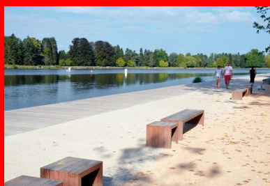
Tous les matériaux choisis rappellent le thème allégorique du « débordement du fleuve ». Ainsi, les granulats utilisés proviennent d'un affluent de l'Allier, la Dore.

Dans cette nouvelle tranche, 1 500 m de rives étaient concernées au cœur de Vichy, entre la Rotonde et la plage des Célestins (à proximité de la fameuse source du même nom), au sud, de part et d'autre du pont de Bellerive. Soit le long des deux grands espaces verts de la ville, le parc Napoléon III et le parc Kennedy (13 hectares au total). « L'idée maîtresse est de rapprocher les Vichysois de leur rivière », résumait Frédéric Aguilera, adjoint aux travaux, dans la presse locale. En plus de l'aménagement des berges, le chantier avait pour objectif le renforcement des connexions avec les parcs et la ville, en privilégiant les « mobilités douces ».