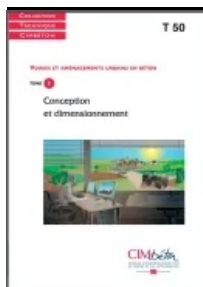
Cet article est extrait de T50. Voiries et aménagements urbains en béton (Tome 1) - Conception et dimensionnement

D'autres paramètres peuvent avoir une influence dans le choix de la technique de construction mais qui sont difficiles à quantifier, comme le coût social et le coût de la sécurité.