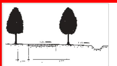
Figure 36: Coupe en travers-type d'une piste cyclable bidirectionnelle destinée à la pratique du cyclisme de loisirs

Pour les pistes cyclables destinées à la pratique du cyclisme de loisirs (conçues indépendamment de tout itinéraire routier), une bande unique à double sens de circulation convient parfaitement (voir coupe en travers-type, figure 36).