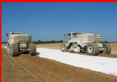
Traitement des sols - Un malaxeur mélange le liant hydraulique routier avec le sol

Il est également possible de retraiter, in situ, les matériaux des chaussées anciennes aux liants hydrauliques routiers , évitant ainsi leur évacuation en décharge lorsqu'ils sont remplacés par des matériaux neufs.