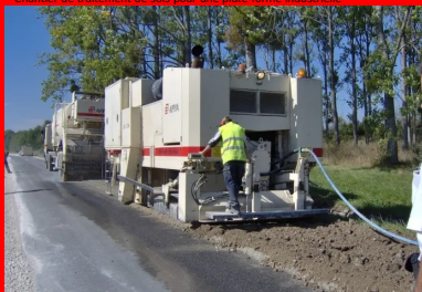
Vue générale d'un chantier de retraitement d'une chaussée en place avec un liant hydraulique routier

Actuellement, les techniques utilisant des liants hydrauliques routiers pour le retraitement en place à froid des chaussées et le traitement des matériaux routiers fonctionnent parfaitement.