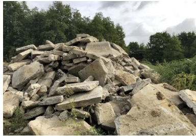
Stockage sur site du béton des allées déconstruites

Une aire de chantier dédiée à la transformation des matériaux, par concassage et criblage des gravats, a été spécialement aménagée sur le site durant les travaux. Une machine œuvrant au quotidien pour le traitement et le recyclage des déchets, limitant ainsi les transports et nuisances y afférents.