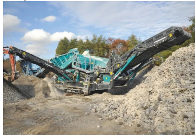
Concassage du béton sur le site