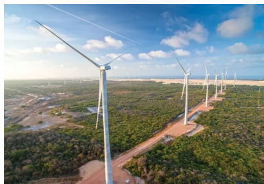
Vue générale de la ferme pilote de Trairi, au nord-est du Brésil. Les 36 éoliennes, dont les tours culminent à 119 m, développent une puissance unitaire de 2,7 MW.

C'est l'outil Eolift qui se substitue à la grue. Pour cela, une petite potence pivotante a été intégrée à chaque demi-côté de l'Eolift. Elle permet notamment de décharger directement les voûtes en béton des camions.