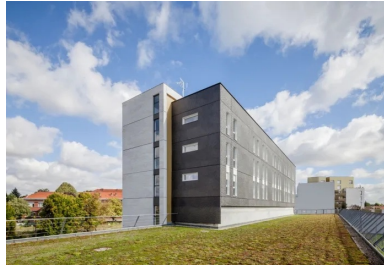
Vue sur la façade sud de la résidence pour jeunes actifs de l'architecte Stéphanie Leclair.

L'ensemble de logements pour étudiants et jeunes actifs construit le long du site de maintenance et de remisage (SMR) de la ligne de tramway numéro 7 sur la rue des Pépinières à Vitry-sur-Seine annonce le développement urbain futur de ce quartier. Ainsi, à l'horizon de la rentrée 2021, l'écocampus du bâtiment sera réalisé en face de cette opération de logements, dans le cadre de la Zac qui se développe au sud du domaine Chérioux. Ce dernier, qui accueillait dans les années 1930 un orphelinat départemental au cœur d'un vaste parc, abrite aujourd'hui le collège et le lycée polyvalent Adolphe Chérioux, ainsi que deux départements de l'IUT de Créteil-Vitry. Avec la création de l'écocampus, la formation des jeunes et l'activité économique seront les caractéristiques principales du quartier à venir.