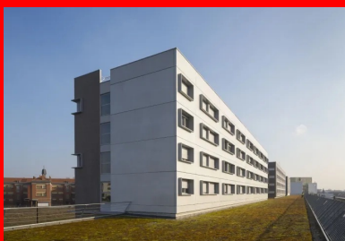
La texture peu marquée recouverte d'une lasure blanche met en valeur la géométrie des panneaux et des ouvertures dans la composition de la façade sud de la résidence pour étudiants dessinée par Dominique Tirard.

Lors de la création du site de maintenance et de remisage, la RATP a conservé une réserve foncière le long de son enceinte nord. Sur 500 m de long, cette dernière se présentait, côté ville, sous la forme de cinq hauts murs de béton reliés entre eux par des parois vitrées. Chaque mur se retourne horizontalement, sur environ 5 m, vers le site de maintenance, constituant ainsi une équerre de béton destinée à porter partiellement une construction future. La bande de terrain naturel libre devant l'enceinte présente, quant à elle, une largeur de 6,5 m. C'est donc sur une partie de ce terrain très atypique que RATP Habitat a lancé un concours d'architecture pour réaliser 262 logements destinés à des étudiants et des jeunes actifs.