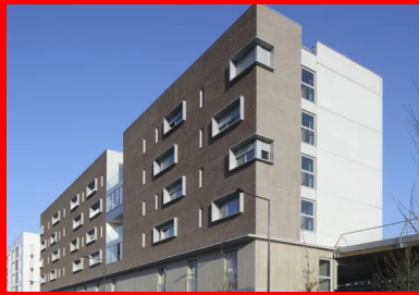
Chaque bâtiment joue de sa différence dans une partition commune.

Deux grues installées entre les bâtiments, au niveau des futurs jardins, ont permis de porter chaque panneau à son emplacement définitif, où il est claveté à la structure. Les immeubles sont isolés par l'intérieur et des rupteurs de ponts thermiques sont mis en œuvre. Le plancher situé au-dessus de l'équerre est coulé en place. Un isolant thermique est placé entre la surface de la dalle et la chape rapportée. L'ensemble du programme est conforme à la RT 2012 et a obtenu la certification Habitat & Environnement . Le volume de la résidence pour jeunes actifs projetée par Stéphanie Leclair est ciselé par le dessin de lignes et de plans, noir, gris foncé ou blanc, réglés dans une géométrie orthogonale. Le plan noir en briquettes de la façade sur rue est ponctué par les fenêtres verticales.