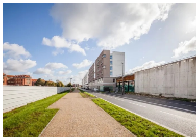
Sur la rue de la pépinière, les trois immeubles composent une amorce de front urbain. Au premier plan à droite, vue d'une équerre en béton sur laquelle sera partiellement construit un futur bâtiment.

« Cela nous a permis de créer une écriture architecturale propre à chaque entité qui présente des façades particulières, des variations dans les rapports entre les pleins et les vides, ainsi que dans les tonalités claires ou sombres, pour moduler les effets de masse et de densité. Dans ce type de programme qui est assez répétitif, nous avons également développé différentes typologies de logements », précisent les architectes.