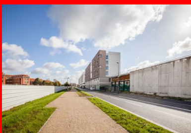
Sur la rue de la pépinière, les trois immeubles composent une amorce de front urbain. Au premier plan à droite, vue d'une équerre en béton sur laquelle sera partiellement construit un futur bâtiment.

« Cela nous a permis de créer une écriture architecturale propre à chaque entité qui présente des façades particulières, des variations dans les rapports entre les pleins et les vides, ainsi que dans les tonalités claires ou sombres, pour moduler les effets de masse et de densité. Dans ce type de programme qui est assez répétitif, nous avons également développé différentes typologies de logements », précisent les architectes.