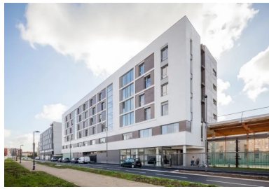
Chaque bâtiment joue de sa différence dans une partition commune.