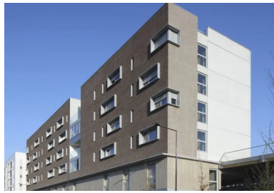
Chaque bâtiment joue de sa différence dans une partition commune.

Deux grues installées entre les bâtiments, au niveau des futurs jardins, ont permis de porter chaque panneau à son emplacement définitif, où il est claveté à la structure. Les immeubles sont isolés par l'intérieur et des rupteurs de ponts thermiques sont mis en œuvre. Le plancher situé au-dessus de l'équerre est coulé en place. Un isolant thermique est placé entre la surface de la dalle et la chape rapportée. L'ensemble du programme est conforme à la RT 2012 et a obtenu la certification Habitat & Environnement. Le volume de la résidence pour jeunes actifs projetée par Stéphanie Leclair est ciselé par le dessin de lignes et de plans, noir, gris foncé ou blanc, réglés dans une géométrie orthogonale. Le plan noir en briquettes de la façade sur rue est ponctué par les fenêtres verticales.