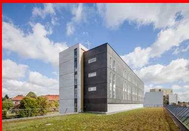
Vue sur la façade sud de la résidence pour jeunes actifs de l'architecte Stéphanie Leclair.

L'ensemble de logements pour étudiants et jeunes actifs construit le long du site de maintenance et de remisage (SMR) de la ligne de tramway numéro 7 sur la rue des Pépinières à Vitry-sur-Seine annonce le développement urbain futur de ce quartier. Ainsi, à l'horizon de la rentrée 2021, l'écocampus du bâtiment sera réalisé en face de cette opération de logements, dans le cadre de la Zac qui se développe au sud du domaine Chérioux. Ce dernier, qui accueillait dans les années 1930 un orphelinat départemental au cœur d'un vaste parc, abrite aujourd'hui le collège et le lycée polyvalent Adolphe Chérioux, ainsi que deux départements de l'UT de Créteil-Vitry. Avec la création de l'écocampus, la formation des jeunes et l'activité économique seront les caractéristiques principales du quartier à venir.