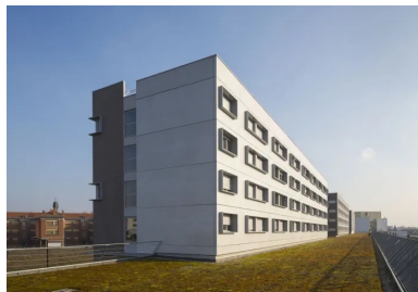
La texture peu marquée recouverte d'une lasure blanche met en valeur la géométrie des panneaux et des ouvertures dans la composition de la façade sud de la résidence pour étudiants dessinée par Dominique Tirard.

Lors de la création du site de maintenance et de remisage, la RATP a conservé une réserve foncière le long de son enceinte nord. Sur 500 m de long, cette dernière se présentait, côté ville, sous la forme de cinq hauts murs de béton reliés entre eux par des parois vitrées. Chaque mur se retourne horizontalement, sur environ 5 m, vers le site de maintenance, constituant ainsi une équerre de béton destinée à porter partiellement une construction future. La bande de terrain naturel libre devant l'enceinte présente, quant à elle, une largeur de 6,5 m. C'est donc sur une partie de ce terrain très atypique que RATP Habitat a lancé un concours d'architecture pour réaliser 262 logements destinés à des étudiants et des jeunes actifs.