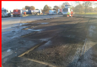
Le béton a été mis en œuvre sur 10 cm d'épaisseur et vibré à l'aide d'aiguilles vibrantes et d'une règle vibrante.

GTM Travaux spéciaux est choisie pour la réalisation du BCMC.