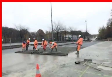
L'ancien enrobé orniéré a été raboté sur une épaisseur de 10 cm. Durée d'intervention pour respecter le planning : une journée.