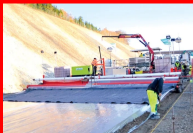
Après la pulvérisation d'un retardateur de surface, le revêtement est recouvert d'un film en polyéthylène.

Un an après, Routes était de retour outre-Quiévrain pour visiter le chantier d'une autre réalisation spectaculaire : le contournement de la commune de Couvin réalisé également en BAC, mais cette fois en bicouche, frais sur frais. Au sud de la Belgique, la commune de Couvin se situe à l'extrême sud-ouest de la province de Namur. Le territoire de la commune jouxte la frontière française. Il s'agit de la plus vaste commune de Belgique après Tournai.