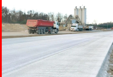
Le BAC recouvert d'un produit de cure. En médaillon : les amorces de fissuration réalisées dans les vingt-quatre heures après bétonnage.

« L'appel d'offres portait sur la réalisation d'une structure rigide pour un trafic de 17 000 véhicules/jour (dont 20 % de PL) et sur sa maintenance, avec la possibilité pour les entreprises d'introduire des variantes, détaille le directeur des routes de la province de Namur, Didier Masset. L'analyse du coût global (construction et entretien) sur une période de service de cinquante ans a conforté l'intérêt du choix d'une chaussée bicouche en béton armé continu. » L'entreprise TRBA a été chargée du chantier.