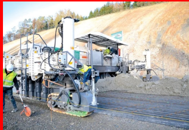
Assurant en une seule opération le coffrage et la vibration, la première machine à coffrages glissants (Wirtgen SP 1500) bétonne sur 17 cm d'épaisseur et sur 10 m de largeur. Au premier plan, le fil de guidage.

Au total, ce sont environ 300 000 m 2 de BAC bicouche qui ont été mis en œuvre sur 2 x 2 voies (+BAU) et sur une longueur de 14 km.