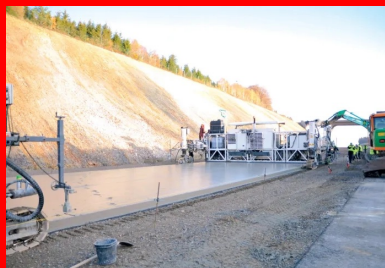
La seconde machine à coffrages glissants suit la première à une distance de 20 m. Elle met en œuvre la couche supérieure du BAC. frais sur frais, sur une épaisseur de 6 cm.

Le directeur technique de TRBA ne cache pas son enthousiasme pour les autoroutes en BAC et pour cette nouvelle réalisation. « En Belgique, une autoroute en béton est aussi confortable qu'une autoroute en asphalte, se félicite Filip Covemaeker. Avantages : un confort de roulement excellent, peu de bruit, une planéité parfaite et une rugosité qui n'évolue pas au fil du temps. »