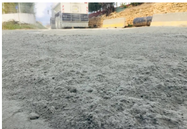
Le liant hydraulique routier après épandage : 190 tonnes de LV-TS 13 de Vicat ont été mises en œuvre à raison de 40 kg/m 2 .

Pour conforter cette option, la communauté d'agglomération du Pays de l'Or prend les conseils de CIMbéton. Elle utilise notamment le logiciel de calcul spécialement mis au point pour comparer les coûts globaux et les impacts environnementaux d'une rénovation de chaussées anciennes. Celui-ci confirme que le retraitement en place est effectivement plus respectueux de l'environnement (pas de noria de camions sollicitant le réseau routier, pas de coût important pour le transfert des anciens ou des nouveaux matériaux, impact réduit sur le bilan carbone), mais également d'un coût inférieur d'au moins 30 % par rapport à un renforcement épais.