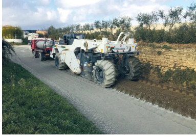
L'atelier de traitement d'Eurovia intervient sur une épaisseur de 32 cm et sur une largeur de 2,50 m par passage