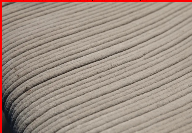
Impression 3D béton par dépôt de couches successives