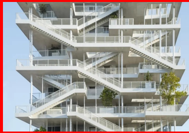
Les circulations verticales communes s'organisent sur les pignons et sont agrémentées de jardinières plantées d'arbres adultes.

L'intelligence constructive s'est également mise au service de la flexibilité. Des doubles planchers techniques ont été mis en œuvre d'une part pour faire cheminer l'ensemble des fluides, et d'autre part pour pouvoir laisser apparente la sous-face de la dalle. Celle-ci est traitée en béton brut apparent. La présence intérieure du béton renforce l'inertie du bâtiment et participe au bon confort thermique intérieur.