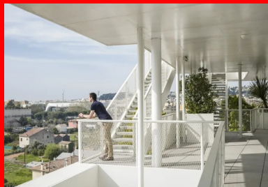
Côté jardin, au sud, les terrasses créent des lieux de travail ou de rencontre informels.

À la pureté des plans répond la sobriété des matériaux mis en œuvre. Ils se limitent au béton , au verre des menuiseries et à l'acier blanc des garde-corps, à l'extérieur ; à de l'espace, de l'air et de la lumière pour ce qui concerne l'intérieur. Économie de moyens ou influence de la récente collaboration des deux concepteurs avec l'architecte japonais Sou Fujimoto pour le projet de l'arbre blanc à Montpellier ?