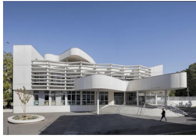
Le parvis d'entrée spectaculaire dessert les deux écoles, maternelle et élémentaire.

Jean-Pierre Lott a conçu son bâtiment au cœur d'un des îlots du quartier des Lochères. C'est dans un écrin de verdure, avec une végétation variée et de beaux et grands arbres, que s'élève le groupe scolaire. La présence de la végétation fut une donnée très importante dans la genèse du projet, car elle est un élément structurant de l'espace existant, brisant la monotonie suscitée par les barres d'immeubles qui cimentent le terrain.