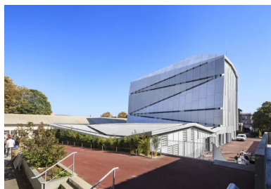
Plus haut que les constructions voisines et abritant sous son aile l'agora, le bâtiment Louis Vicat est le nouveau centre névralgique du campus.

Cette association béton/métal étant une première, elle a nécessité un long travail d'études et d'essais avant d'aboutir à un système efficace et sûr en matière d'accrochage. Les inserts inox ont été scellés dans le béton à l'arrière des plaques lors de leur préfabrication . Le positionnement de ces fixations invisibles a nécessité un soin particulier et une précision inédite pour un ouvrage réalisé en béton, tout autant d'ailleurs que le calepin des panneaux. Ces derniers ont été mis en place sur plan incliné par un engin de levage spécifique avec outil à ventouses, de façon à pouvoir respecter leur orientation au dixième de degré près tout en évitant au maximum la casse.