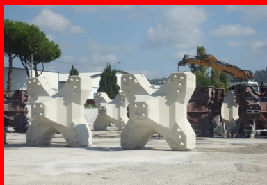
Les ACCROPODE (TM) Il sont des blocs en béton coulés en une fois dans des moules spécifiques. Ils sont dotés de protubérances tronconiques qui optimisent l'accrochage des éléments entre eux et permettent d'augmenter la pente d'une digue à talus.

Le confortement des digues est réalisé par un groupement d'entreprises qui mettent en commun leur expertise et leurs moyens pour assurer les travaux maritimes, le génie civil, l'insertion des réseaux et la préfabrication des éléments en béton (ACCROPODE™ Il et mur chasse-mer). Les travaux se sont déroulés d'octobre 2018 à avril 2019 par voie terrestre, le parking Laubeuf servant de plateforme de chantier. L'exiguïté à l'extrémité de la digue n'a pas simplifié les conditions de réalisation et a nécessité la construction d'ouvrages temporaires. La cinématique fut structurée en trois étapes, à commencer par la dépose d'une sous-couche d'enrochements (200 cubes en béton) et d'enrochements naturels (10 000 m 3 ) en pied de l'ouvrage. La deuxième étape fut de reconfigurer le profil de la digue avec la mise en place de 1 179 ACCROPODE™ Il dont la forme, le volume (4 m 3 ) et le poids (9,6 t) rendent la carapace particulièrement résistante aux assauts de la mer. Enfin, la première phase s'est terminée avec la réalisation d'une partie du mur chasse-mer.