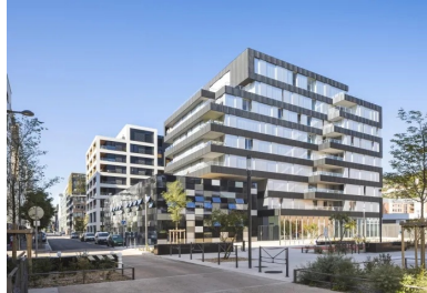
Les trois bâtiments du site dessinent un petit pôle urbain.