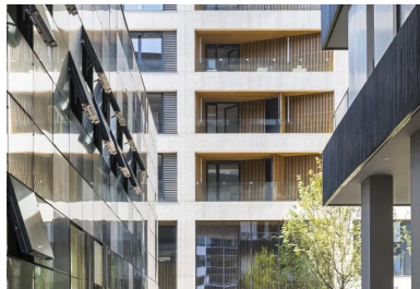
Passage urbain entre les trois bâtiments du site.

Elle permet aussi de créer en façades est, ouest et sud de grandes loggias de plus de 2,40 m de profondeur communes à toutes les pièces de logement, ce dont beaucoup d'habitants se félicitent. « Au quotidien, passer d'une pièce à l'autre et d'une façade à l'autre par l'extérieur en profitant de ces loggias bi-orientées ajoute à l'indéniable qualité d'usage de cet immeuble et au plaisir de vivre ici », témoigne l'un des occupants d'un logement d'angle qui nous a conviés à une visite. Il est de fait qu'à l'intérieur des appartements, ces grandes loggias et leurs embrasures élargissent le champ visuel vers les vues extérieures tout en préservant l'intimité.