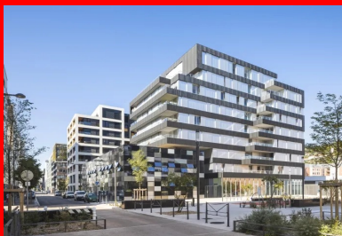
Les trois bâtiments du site dessinent un petit pôle urbain.