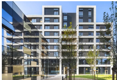
Les logements sociaux et leurs rubans de béton lasuré noir.

Légèrement décalés, les deux bâtiments se font face autour d'un grand jardin central relié à l'espace public du quartier. Ils se caractérisent par deux écritures que les architectes ont délibérément choisi de bien différencier pour instaurer une diversité dans l'ambiance de ce petit brin de ville. En bordure nord-est, un troisième petit volume réservé aux activités commerciales vient parachèvement l'ensemble en créant un porche urbain. Il est complété au sud par une serre-atelier que les habitants du quartier sont invités à investir pour des activités collectives ou associatives en lien avec les potagers familiaux occupant le toit du bâtiment nord.