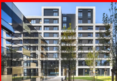
Les logements sociaux et leurs rubans de béton lasuré noir.

Légèrement décalés, les deux bâtiments se font face autour d'un grand jardin central relié à l'espace public du quartier. Ils se caractérisent par deux écritures que les architectes ont délibérément choisi de bien différencier pour instaurer une diversité dans l'ambiance de ce petit brin de ville. En bordure nord-est, un troisième petit volume réservé aux activités commerciales vient parachever l'ensemble en créant un porche urbain. Il est complété au sud par une serre-atelier que les habitants du quartier sont invités à investir pour des activités collectives ou associatives en lien avec les potagers familiaux occupant le toit du bâtiment nord.