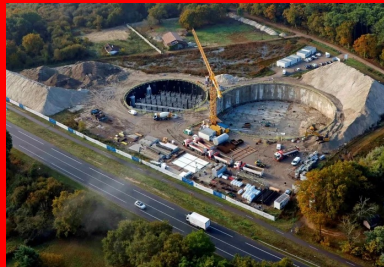
Les travaux de terrassement à l'intérieur des cylindres ont pu être menés une fois l'enceinte étanche achevée.

Une fois ces cylindres géants verticaux réalisés, un « bouchon » d'étanchéité horizontal une forme de radier provisoire de 1,5 m d'épaisseur, constitué d'un mélange de coulis de ciment et de silicate a été injecté à 19 m de profondeur via un maillage dense (1,2 x 1,2 m) de canules des tubes verticaux.