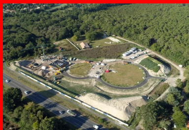
Implantés à quelques mètres de la départementale, les deux bassins enterrés, recouverts d'herbe, sont totalement invisibles, un talutage sépare le site d'avec la route.

Ces monolames de 9 m de haut, 2 m de large et de 12 cm d'épaisseur ont été préfabriqués sur site. « La plaque de PEHD, mise au fond du moule, était munie de picots, ce qui permettait de la solidariser avec le béton lors de la prise », décrit Patxi Sallaberry. Une fois décoffrés, ces éléments de 5,4 t étaient positionnés à 13 cm de la paroi moulée où, à la manière d'un prémur, un remplissage en béton du vide entre les éléments et la paroi moulée permettait de les intégrer définitivement à celle-ci.