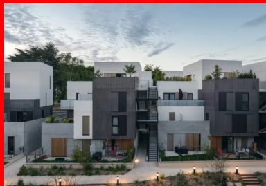
Les escaliers, situés à l'extérieur, créent des failles de circulation.

À l'origine du projet, l'agence INCAA - Carril Architectes participe à une première consultation en interne régie par le futur maître d'ouvrage Interconstruction pour définir les principes d'aménagement. Elle est ensuite lauréate du concours organisé par l'aménageur Yvelines Aménagement.